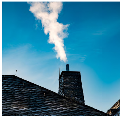
Abb. 11 Abgasfahne gut

Findet eine gute Verbrennung statt, bildet sich eine kaum sichtbare weiße Fahne aus, welche besonders bei kühlerer Witterung nicht auf dem Schornstein aufsitzt und erst einige Zentimeter darüber sichtbar wird (Abb. 11). In dieser wird hauptsächlich der an der kühleren Luft kondensierende Wasserdampf sichtbar. Diese weiße Abgasfahne ist bei Festbrennstofffeuerungen nicht so stark ausgeprägt wie bei Gasfeuerungen. Eine Abgasfahne welche von der Farbe ins gräulich-schwarze tendiert, kann ein Anzeichen einer ungenügenden Verbrennung sein (Abb. 12). Die Färbung wird durch Ruß- oder Aschepartikel hervorgerufen, welche sich im Verbrennungsprozess bilden oder mitgerissen werden.