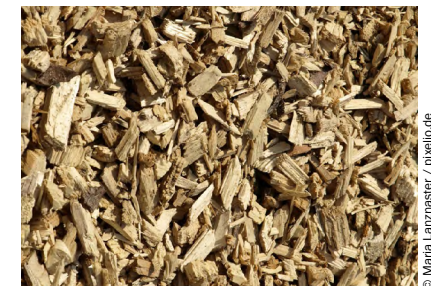
Abb. 4 Holzhackschnitzel sehr guter Qualität