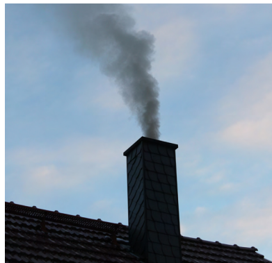
Abb. 12 Abgasfahne schlecht