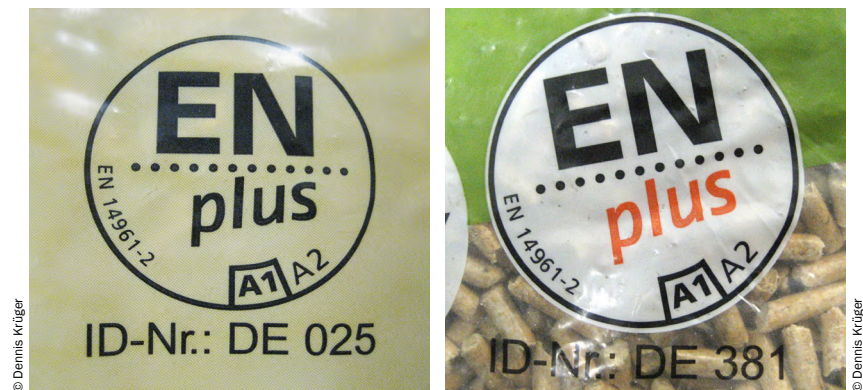
Abb. 7 ENplus Siegel

Sowohl für Holzpellets, als auch für Holzhackschnitzel existieren Zertifizierungsverfahren, die eine gleichbleibende Qualität des Brennstoffs garantieren sollen. Die ENplus Zertifizierung, welche unterschiedliche Qualitäten definiert, stellt den strengsten derzeit verfügbaren Standard dar. Weiterhin sind die Brennstoffe durch eine ID komplett rückverfolgbar und es existiert ein Beschwerdemanagement für den Endkunden. In Abbildung 7 sind zwei beispielhafte ENplus Siegel samt ID dargestellt. Neben der ID ist auch die Brennstoffqualität vermerkt - hier A1. Für die Lieferung von loser Ware per LKW ist bei ENplus Qualität ein Zertifikat auszuhändigen, aus dem die gezeigten Angaben hervorgehen. Die auf den Siegeln abgebildete Norm EN 14961-2 wurde mittlerweile durch die Norm ISO 17225-2 abgelöst.