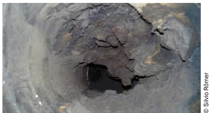
Abb. 8 Verkrustungen im Rauchgasweg

Ein besonderes Augenmerk bei der Reinigung sollte man auch auf die waagerechten Teile der Abgasanlage legen. In diesen Bereichen können sich große Mengen an Asche ansammeln, welche sich mit der Zeit aufgrund der Kondensatbildung während des Anlagenstarts zu harten Krusten verbacken können (siehe Abb. 8).