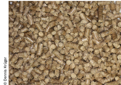
Abb. 1 Pellets schlechter Qualität

Ebenso wie über einen geringen Feinanteil sollten diese auch über einen nur geringen Grobanteil verfügen. Große Äste, Wurzelballen, Steine oder gar Metallteile sollten nicht im Brennstoff vorzufinden sein (Abb. 6), da diese die Brennstoffzuführung blockieren und beschädigen können.