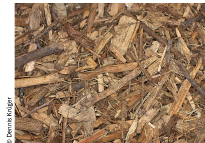
Abb. 5 Holzhackschnitzel aus Waldrestholz mit hohem Fein- und Rindenanteil