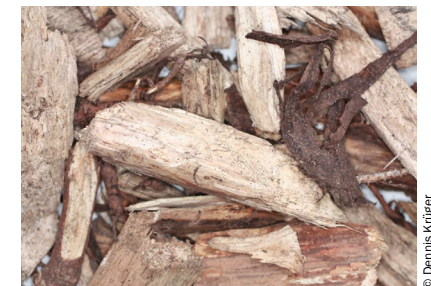
Abb. 6 Holzhackschnitzel mit hohem Grobanteil und Geäst