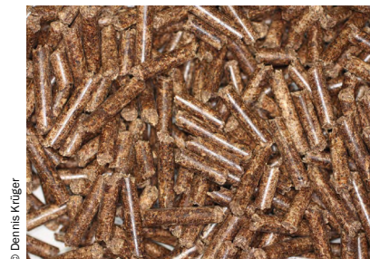
Abb. 3 Holzpellets mit 30% Rindenanteil