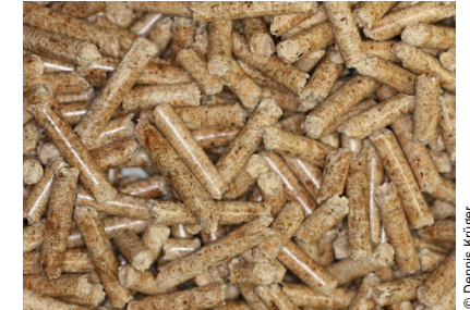
Abb. 2 Holzpellets sehr guter Qualität