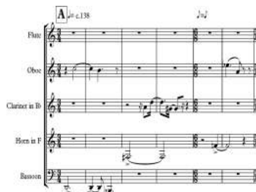
Ex. 14 – Trecho da subseção A1 de Háptico II

nesta subseção inicial, evitar o forte elemento motivico enfatizado pela imitação, também bastante presente em Háptico I .