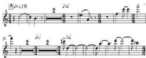
Ex. 13 – Uso do grupo-teorema 1 na subseção A1 de Háptico II

Foi desenvolvida a ideia de uma polifonia, na qual cada grupo-teorema seria trabalhado exclusivamente em uma voz, sem ser repetido ou imitado em outra (Ex. 14). Deste modo, buscou-se,