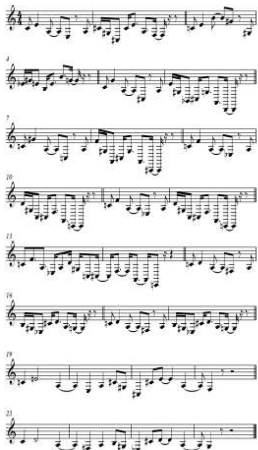
Ex.10 – Grupos-teoremas do axioma 2(a) partir de Sonatine pour Flute et Piano

retrogradação, aumento, expansão, contração, multiplicação, etc.). Por exemplo, a partir do grupo axiomático 2a (Ex.3) da Sonatine pour Flute et Piano , foram criados vários grupos-teoremas, alguns dos quais apresentados no Ex.10.