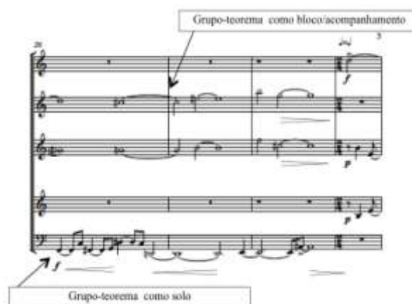
Ex. 15 – Uso dos grupos-teoremas na subseção A2 de Háptico II

A subseção A2 utiliza os mesmos grupos-teoremas de A1, todavia, alternados, ora como voz "solo" (aparecendo de maneira completa, sem a fragmentação da subseção A1), ora para formar um bloco de duas ou três partes sonoras (Ex. 15). Desta forma, o esboço utilizado para esta subseção é o mesmo de A1, porém desenvolvido de maneira distinta.