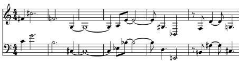
Ex. 18 – Ostinato com o grupo-teorema 5 (axioma 1) na subseção C1 de Háptico II

A Seção C é composta por duas partes menores. A subseção C1 se inicia com um ostinato do grupo-teorema 5 em configuração [2^1] – a qual compõe parte da textura planejada [1^3 2^1] – executado pelas vozes mais graves, no caso, trompa e fagote (Ex.18).