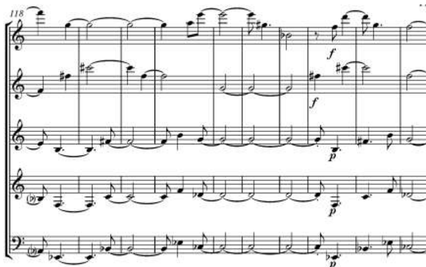
Ex. 25 – Ápice da configuração textural ( 1^2 3^1 ) na subseção C2 de Háptico II

Em seguida, o grupo-teorema 5 é utilizado em sua forma original, sendo também segmentado em duas partes, que são então sobrepostas: a primeira sobre a segunda (flauta e oboé) e depois o contrário com a mesma instrumentação. O bloco de três instrumentos que funciona como acompanhamento é composto pelo grupo-teorema 13, transformado por aumentação, tendo seu último inciso repetido (Ex. 25).