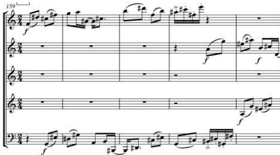
Ex. 29 – Trecho inicial da seção B` – Háptico II