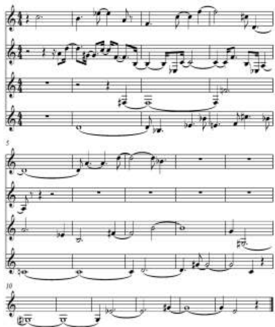
Ex. 11 – Esboço da subseção A1 – Háptico II

2 de Avant l' artisan furieux (ver esboço Ex. 11)