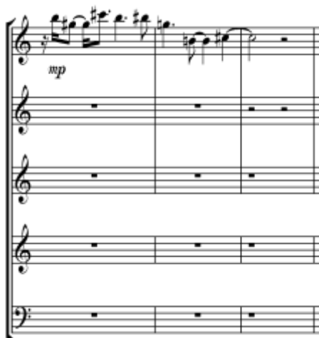
Ex. 24 – 2ª parte do grupo-teorema 5 em monodia na subseção C2 de Háptico II

Em seguida, o grupo-teorema 5 é utilizado em sua forma original, sendo também segmentado em duas partes, que são então sobrepostas: a primeira sobre a segunda (flauta e oboé) e depois o contrário com a mesma instrumentação. O bloco de três instrumentos que funciona como acompanhamento é composto pelo grupo-teorema 13, transformado por aumentação, tendo seu último inciso repetido (Ex. 25).