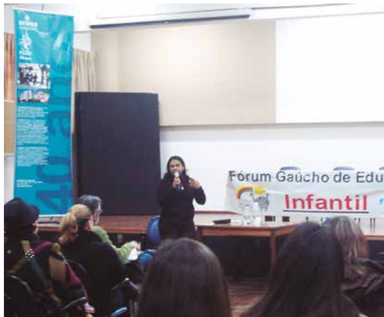
Figura 3: Reunião Plenária Fórum Gaúcho de Educação Infantil, em julho de 2015

Ações de apoio a iniciativas dos movimentos sociais também são atividades realizadas neste Programa, bem como intercâmbios com outras agências formadoras, em âmbito nacional e