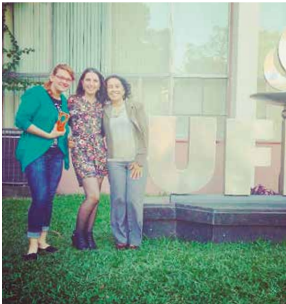
Figura 6: Equipe do Programa Educação Infantil na Roda na cerimônia de destaques do Salão de Extensão da UFRGS 2015

Para proceder a essa atualização, foi desencadeado, com o apoio de bolsistas de extensão, um processo de sistematização de informações e materiais, permitindo a constituição e atualização de acervo histórico do Programa. Essa sistematização de informações e materiais contribuiu para a formação de acadêmicos, em temas relativos à infância e seus direitos, às demandas relativas à formação docente e às políticas e práticas educacionais para a pequena infância, exigindo um descentramento da equipe na busca de uma