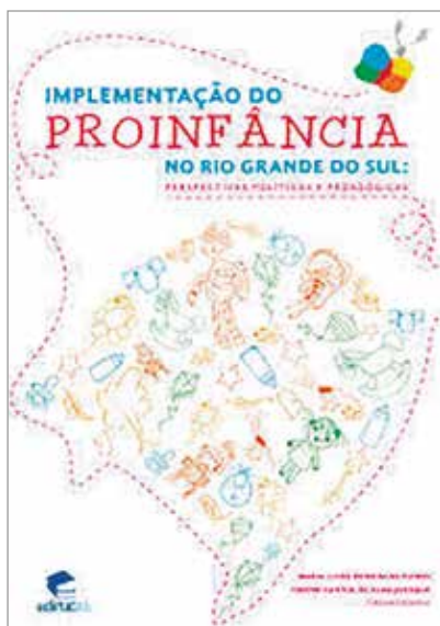
Figura 4: Imagem do livro lançado