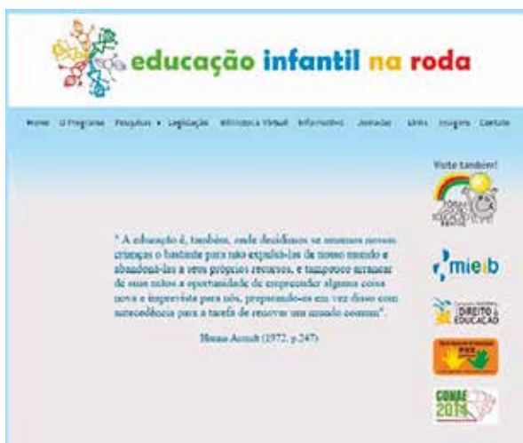
Figura 5: Home do site do Programa

Uma das ações realizadas pelo Programa em 2015, que também efetivou uma integração interinstitucional foi a Jornada de Estudos Olhares sobre o Currículo na Educação Infantil . Este evento integrou a Jornada de Estudo do Programa Educação Infantil na Roda com o Curso de Especialização em Docência na Educação Infantil (Faced/UFRGS/MEC) e, ainda, com o Encontro Estadual do FGEI. Esta Jornada de Estudos teve grande número de interessados, superando o número de vagas em poucos dias, sendo demandada a possibilidade de transmissão on-line , o que permitiu a participação de pessoas de diversos locais no país. Os painéis apresentados no evento