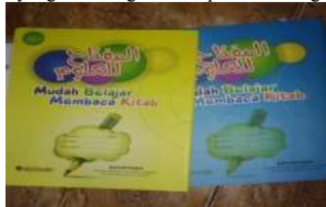
Gambar 1.1 Media yang digunakan dalam bimbingan “Kitab Al Miftah Terbitan sidogiri”

Setelah izin beres peneliti atau pelaksana melakukan persiapan yang berkaitan dengan media-media yang akan di gunakan. Media itu berupa: Kitab Al Miftah, Papan tulis, Spidol dan penghapus. Untuk papan tulis dan penghapus sudah tersedia di pondok pesantren sabilul Huda, dan untuk kitab di sediakan “ Kitab Al Miftah ” yang di datangkan dari pondok Sidogiri pasuruan.