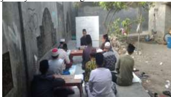
Gambar 1.2 peserta mendengarkan penjelasan tentang kitab Al Miftah.

Dengan sulitnya mempelajari ilmu alat nahwu dan shorof bagi santri, solusi yang ditemukan adalah menggunakan metode yang mudah dan praktis yaitu metode kitab Al Miftah. Metode ini berasal dari sidogiri yang kitabnya sudah populer dan terpakai di pondok-pondok salaf, kitab ini menjelaskan tentang lmu nahwu dan shorof secara simpel dan jelas. di kitab Al Miftah juga ada lagu-lagu yang mudah dihafal sebagai pengingat materi-materi yang ada dalam kitab tersebut. Serta sistem pembelajarannya bisa di bilang asik dan rame.