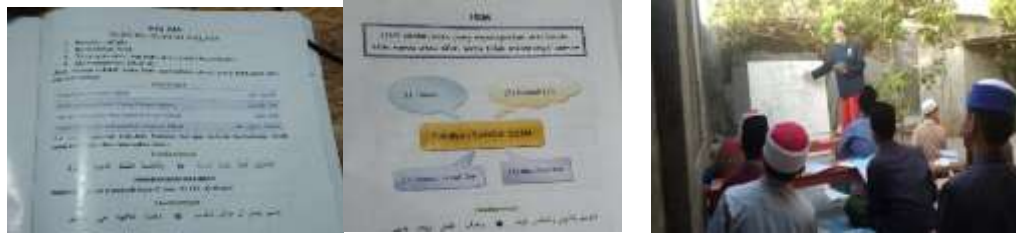
Gambar 1.3 Bimbingan belajar ilmu alat nahwu dan shorof melalui kitab Al Miftah dan materi yang diajarkan dalam bimbingan.