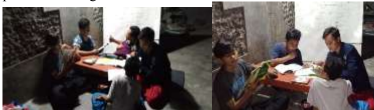
Gambar 1.5 bimbingan khusus bagi santri yang belum faham

Untuk tahap ini peneliti atau pelaksana mengkhususkan membimbing ulang peserta yang belum faham tentang materi yang telah di sampaikan di pagi hari, pada malam harinya mengulang Kembali materi yang belum di pahami di model seperti diskusi khusus dengan peserta bimbingan.