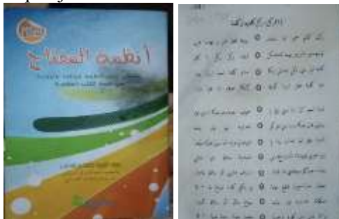
Gambar 1.4 buku lagu yang memuat rumus-rumus menghafal materi.

Untuk tahap ini peserta di suruh menghafal lagu, yang lagu itu ada di kitab kecil khusus memuat lagu-lagu. Fungsinya agar peserta mudah mengingat rumus-rumus materi yang sdh di pelajari.