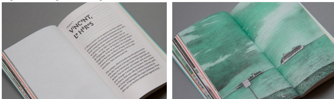
Figura 4 – Páginas da segunda versão da história.

No projeto gráfico dessa segunda versão, vemos que as margens são mais estreitas que na versão precedente, além do corpo de texto também ser menor (Fig. 4). A tipografia utilizada no bloco de texto chama-se Anselm e apresenta serifas finas e variação de espessura no traçado das letras, o que a localiza no grupo das famílias tipográficas romanas oldstyle , o mais habitual para obras de leitura contínua (romances, por exemplo). No entanto, a tipografia utilizada nos títulos dos capítulos (chamada Infini) apresenta grande variação na altura dos caracteres, desenhando palavras cuja linha de base ziguezagueia verticalmente, construindo certo efeito de sentido de “informalidade” que se contrapõe à tipografia mais formal dos blocos de texto. Ou seja, a combinação tipográfica nos posiciona entre o lúdico e o sério, entre o infantil e o adulto.