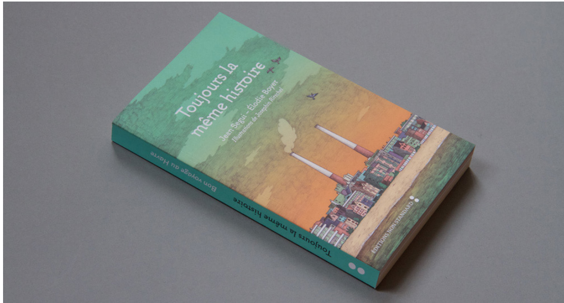
Figura 1 – Capa e volume de Toujours la même histoire .