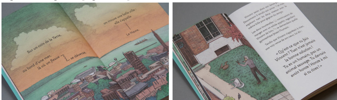
Figura 3 – Algumas páginas da primeira versão da história.

não há numeração nas páginas ou divisão em capítulos. A família tipográfica utilizada, Nicostrate, é pesada (apresenta traços grossos), não possui variação de espessura e alguns de seus caracteres possuem serifa grossa, outros não, o que confere uma variação e irregularidade no desenho das letras que faz com que a própria tipografia utilizada produza efeitos de sentido como “diversão” e “informalidade”. Além disso, a tipografia é grafada em corpo grande (cerca de 16 pontos), o que também respeita a tradição editorial dos livros infantis.