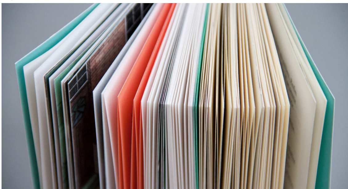
Figura 2 – Diferença de materiais no miolo do livro.

Em Toujours la même histoire , algumas dessas qualidades matéricas são utilizadas como critério de diferenciação entre as três versões sucessivas da história. Assim, a primeira versão, para o público infantil, é impressa no papel Munken Print White 115g/m 2 , um papel rugoso e bastante espesso; a segunda versão, juvenil, é impressa no papel Milk White 85g/m 2 , um papel também rugoso, mas um pouco mais fino e flexível; a terceira versão, adulta, é impressa no Arcoprint Edizioni Arvorio 80g/m 2 , um papel bem mais fino, mas igualmente rugoso (Fig. 2). Assim, a categoria “espesso vs. fino” diferencia as três histórias, em um trajeto sensível que vai do papel mais espesso na versão infantil até o mais fino na versão adulta, enquanto a categoria “rugoso vs. liso” unifica as três versões, apresentando uma tatilidade rugosa em todos os papéis escolhidos para a obra.