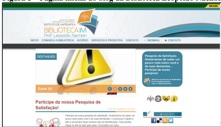
Figura 1 – Página inicial do blog da Biblioteca Leopoldo Nachbin