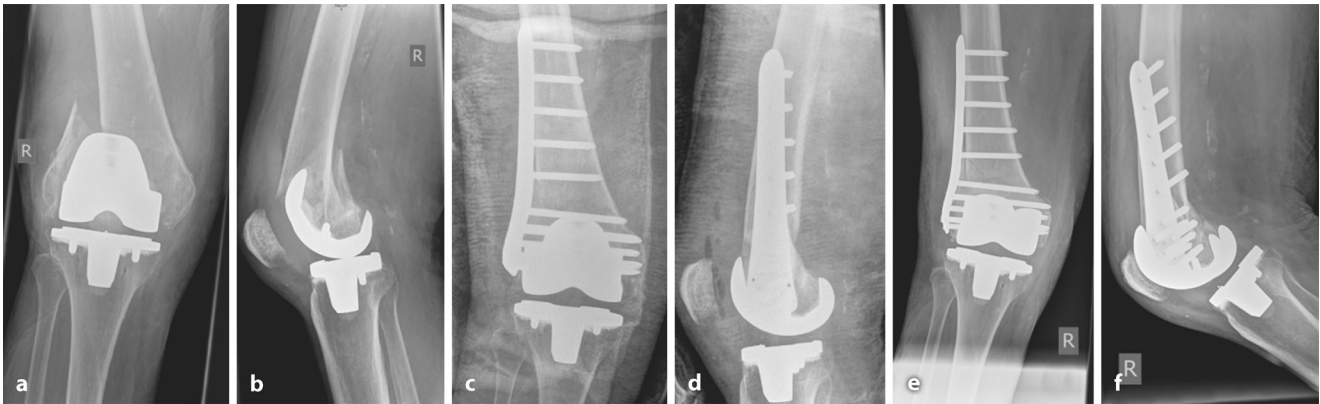
Abb. 2 ▲ Fallbeispiel: 83-jährige Patientin nach Sturz: Röntgenaufnahmen präoperativ (a,b), am 1. postop. Tag (c,d) und nach 6 Wochen (e,f)

faktor auf das klinische Outcome und die Mortalität in unserem Patientenkollektiv dar, wesentlichler als beispielsweise die Frakturklassifikation, präoperative Liegedauer, stationäre Aufenthaltsdauer oder intraoperative Parameter.