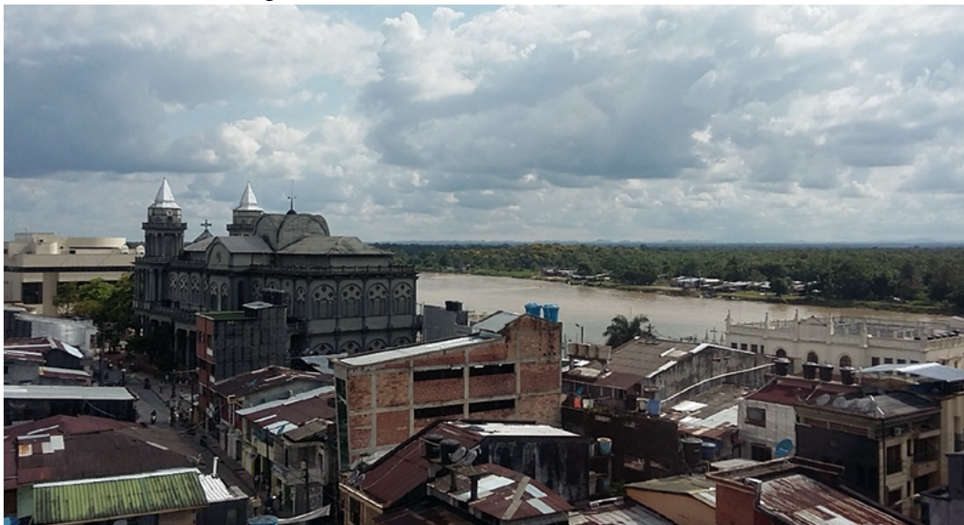
Figura 3. Panorámica de Quibdó desde el norte

Nota: se muestran casas típicas y los principales edificios monumentales (Catedral San Francisco de Asís, Banco de la República y Diócesis).