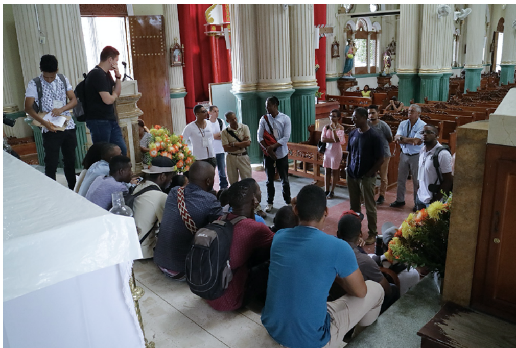
Figura 6. Alumnos durante la visita a la catedral