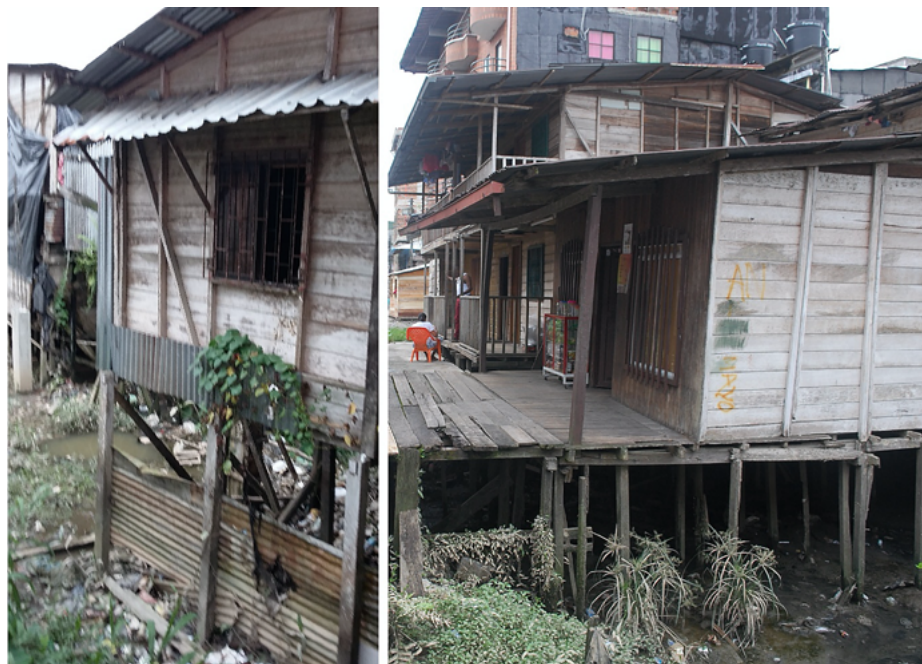
Figura 9. Palafitos en la Quebrada La Yesca, barrio La Yescagrande

han adoptado enfoques críticos para las modificaciones históricas del patrimonio, creando experiencias arquitectónicas en el diseño de la conservación. Estos aspectos fueron explorados por los estudiantes e instintivamente generaron ideas para hacer que dichos edificios sean relevantes para su práctica de diseño, y expandir el canon de la conservación al patrimonio moderno asociado con las preocupaciones contemporáneas, como la inclusión y la sostenibilidad. Entonces, ¿podría el taller crear una “conciencia histórica” en el enfoque de los estudiantes sobre el entorno urbano de Quibdó? Indudablemente.