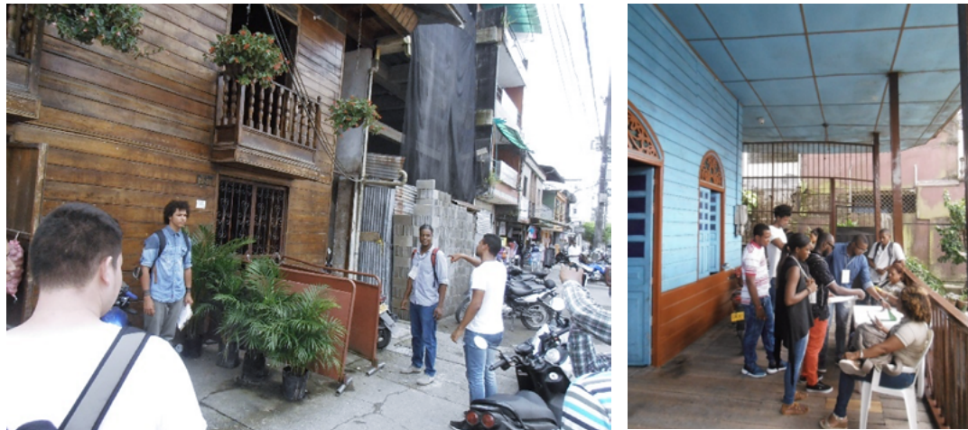
Figura 4. Trabajo de campo en Quibdó

Nota: estudiantes de la UTCH durante el levantamiento arquitectónico de los patrones de composición típicos. Izquierda: la muy bien conservada Casa Copete (Carrera 5 y Calle 27, barrio Cesar Conto). Derecha: Casa Medina (Carrera 7 y Calle 24, barrio La Yescagrande).