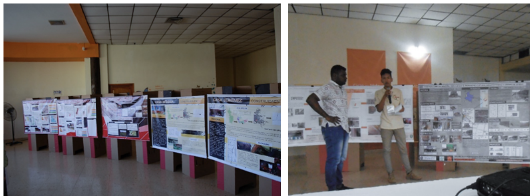
Figura 7. Ejemplos del trabajo de los estudiantes y la exhibición final