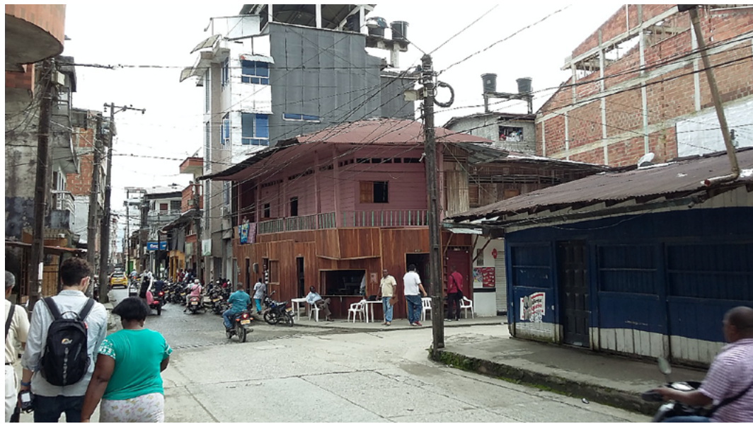
Figura 8. La arquitectura contemporánea de Quibdó

Enmarcar el taller en el debate contemporáneo (figura 2) sobre la importancia del trabajo de campo en los procesos de aprendizaje (France & Haigh, 2018; Dunphy & Spellman, 2009; Fuller et al. , 2006; Scott et al. , 2006), muestra algunos avances adicionales. La asignación de pequeños ejercicios de solución de