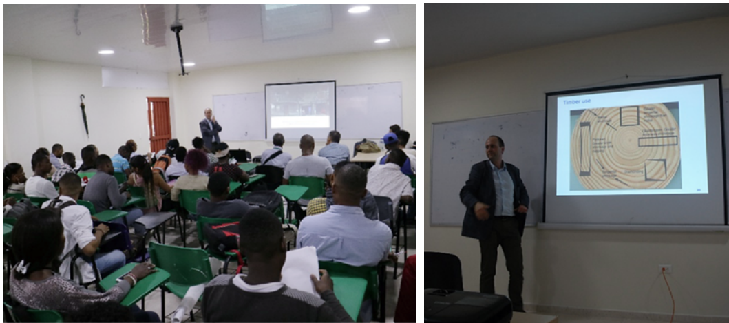
Figura 5. Charla-conferencia durante el primer día del taller

El análisis posterior continuó el cuarto día, los estudiantes comenzaron a preparar sus presentaciones para la revisión. En la tarde, los grupos presentaron sus análisis y propuestas en el auditorio con la ayuda de pósters (figura 7). Los propietarios de las casas estudiadas fueron invitados a la revisión, en especial, la propietaria de Casa Medina, quien generó una discusión muy significativa sobre la importancia de preservar los edificios de madera en