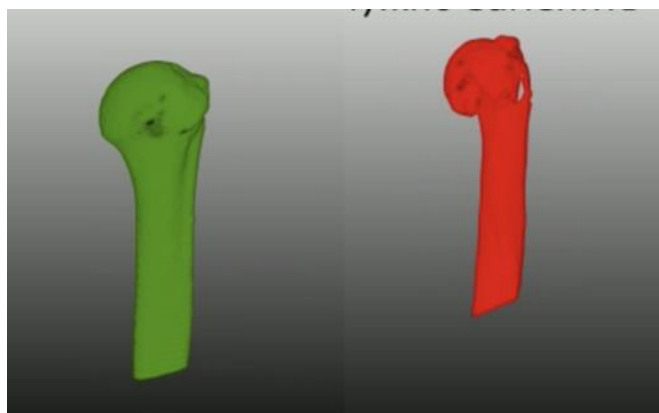
Рис 1. Модель здоровой (зеленый цвет) и сломанной (красный) костей, выполненные в программном пакете MeVisLab

После этого модели имплантов сохранялись отдельно в STL-формате для передачи на 3D-принтер. Данный формат используется для хранения трёхмерных моделей объектов при задействовании их в аддитивных технологиях .