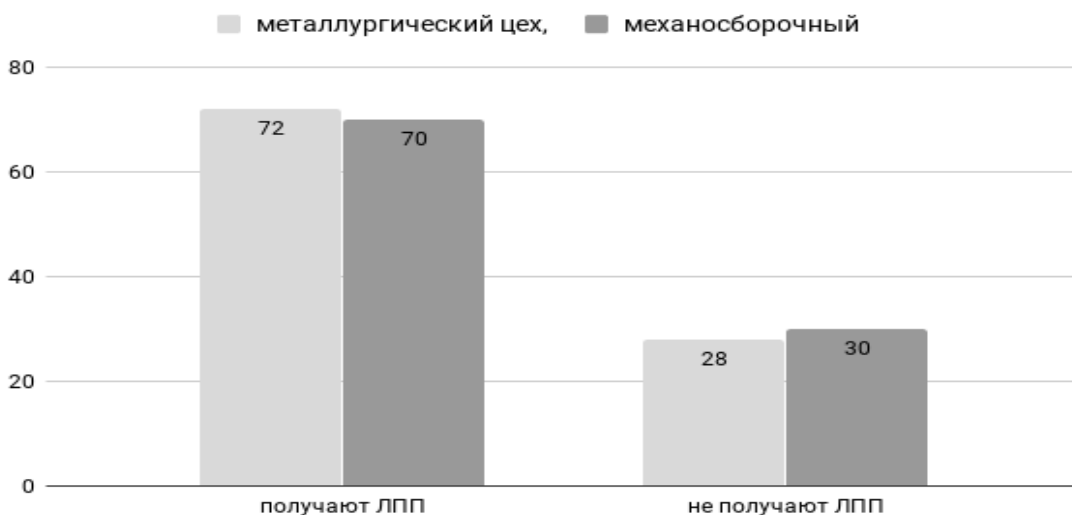
Рис. 1. Организация ЛПП в цехах, %

По результатам исследования было выявлено, что в механосборочном цехе получают ЛПП 64% (32 чел.) рабочих, в металлургическом - 72% (36 чел.) (рис.1).