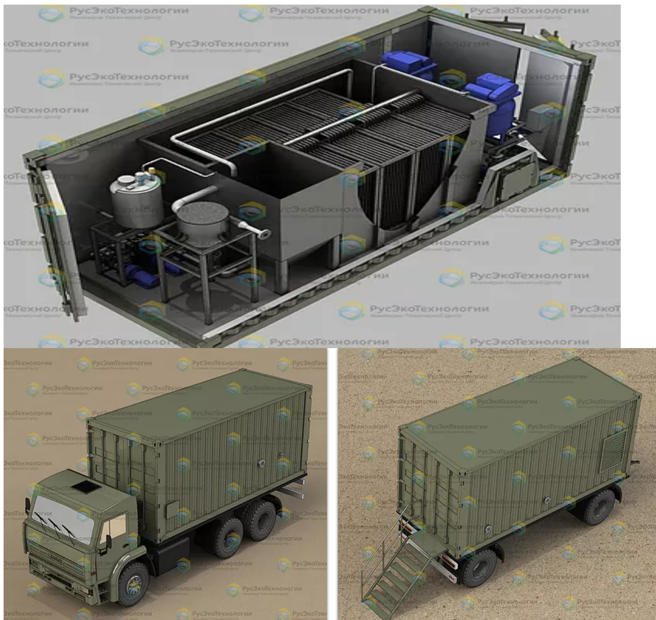
Рис. 2. Вид передвижного модуля изнутри, в транспортируемом и унифицированном виде.

Так как рабочий объём модуля составляет 40 \text{ м}^3/\text{сут.} , то есть 40000 литров, то лаборатория может производить то количество воды, которая необходима для приготовления любых медицинских растворов.