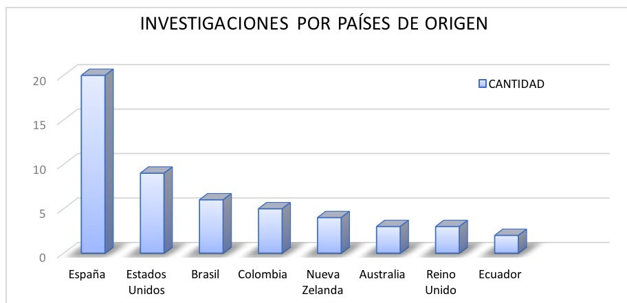
FIGURA 3 Número de investigaciones por países con más de una investigación

Los artículos estudiados presentaron mayor concentración de publicación en 2015, con ocho, y en 2011, 2012 y 2013, con siete por cada año respectivo. Se evidencia que cada año se realizaron y divulgaron, en promedio, entre cuatro y cinco investigaciones sobre autoevaluación. En cuanto a la ubicación geográfica de las publicaciones, hay representación de todos los continentes, según los países que los conforman (figura 3). Entre los países europeos se encuentran España (20) 3 , Reino Unido (3), Holanda, Irlanda, Hungría, Rumania, Macedonia, Finlandia y Turquía; de América del Norte y América del Sur: Estados Unidos (9), Brasil (6, uno es compartido con España), Colombia (5), Ecuador (2), México, Trinidad y Tobago; de África se registran Botsuana, Egipto y Sudáfrica; del resto del mundo hay aportes desde Catar, Malasia, Singapur, Japón, Hong Kong, Australia (3) y Nueva Zelanda (4).