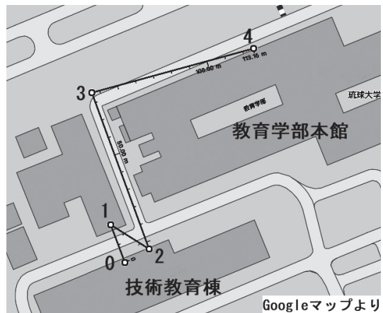
図8 遠隔地の温度測定

また、複数のmicro:bitで中継を行うことで、遠隔地の測定を実現することができた。