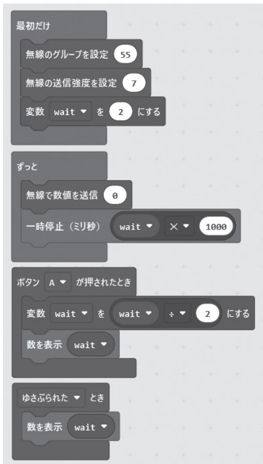
図1 送信機のプログラム