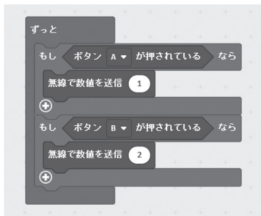
図6 ボタン〇が押されている