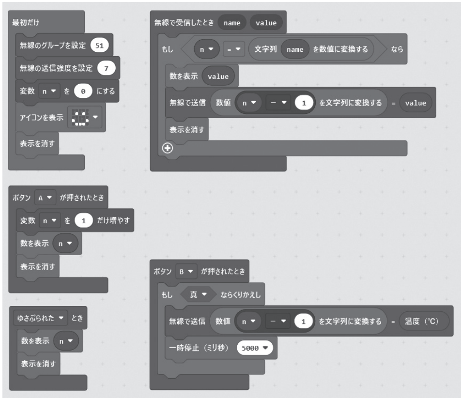
図7 複数の micro:bit を中継させた遠隔温度測定プログラム

た場合、温度値valueを表示した後、送信機と同様、自機の固有番号から1引いた番号と受信した温度値valueを送信する。