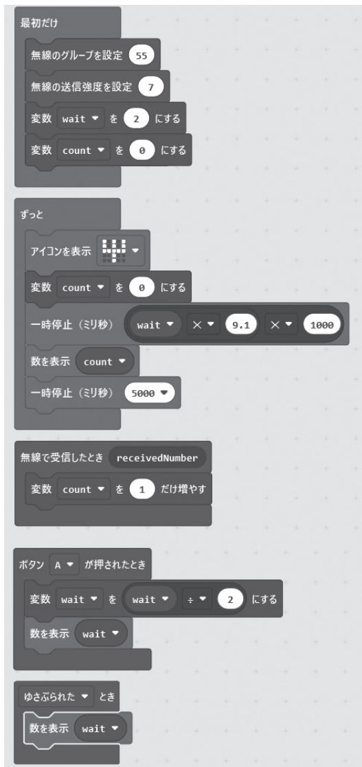
図2 受信機のプログラム

送信機より2秒おきに送られる信号を、受信機で約18秒間受信させ、受信回数を測定するということを、距離を10mずつ変えながら一か所につき5回行う。