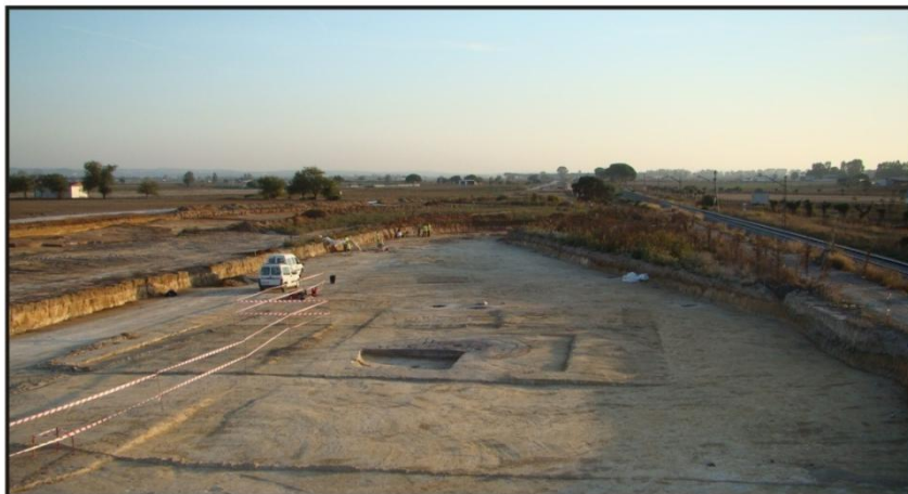
Figura 4. Extensión de sectores 1 y 2 de la zona A en “Canal de Guadalcaén II

Asimismo, la gran superposición de estructuras existente y la secuencia estratigráfica del yacimiento, donde destaca sobre gran parte de la superficie un amplio estrato limo-arcilloso, interpretado como un depósito sedimentario de carácter fluvial, nos lleva a establecer varias fases de ocupación en el mismo terreno, aunque para ellas tan sólo podamos ofrecer en este momento una cronología relativa.