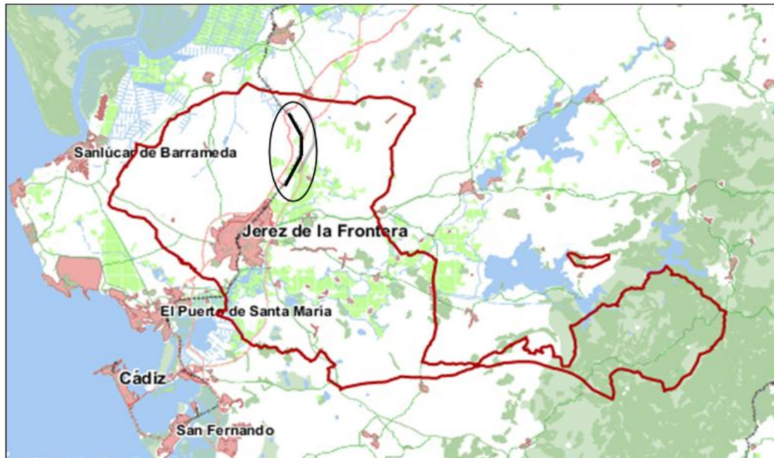
Figura 1. Localización de la intervención, en la zona Norte de la campiña gaditana.

sobre el territorio que nos ocupa, que fueron excavados únicamente en la zona de afección de la obra en cuestión.