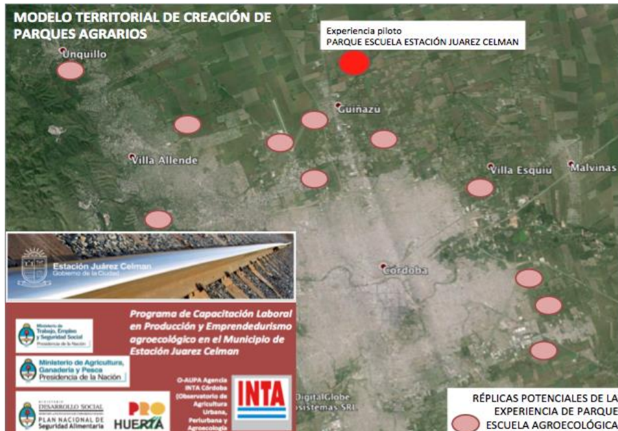
FIGURA 2. Mapa localización de la experiencia y estrategia de réplica en el área metropolitana de Córdoba

concientizar y promover una mejor calidad de vida mediante el consumo de productos sanos y de mayor calidad producidos localmente.