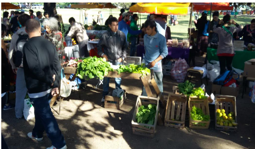
FIGURA 1. Venta en Feria Agroecológica Córdoba

Para que los/as estudiantes encuentren alguna actividad que sea de su agrado, y con la cual se identifiquen como emprendedores con una proyección de futuro, se les propone unos objetivos en el 1º curso que consisten en aprender conceptos teórico-prácticos básicos: producción agroecológica (huerta, frutales, aromáticas, flores, huevos, compost, dulces y envasados, etc.); higiene y seguridad laboral, derecho al trabajo y economía social, manipulación de alimentos y normativa municipal en bromatología. En el 2º curso se complementará con: construcción de cisterna y cosecha de agua de lluvia para producción en contextos de escasez de agua; añadir valor a la producción (dulces, salazones, envasado, lombri-compuestos, etc.); gestionar un emprendimiento propio (contabilidad, organización empresarial, gestión financiera, aspectos impositivos, comercialización, atención al público, marketing de producto, etc.); construcción de macro túnel para la producción de plantines; producción de hongos y gírgolas; aromáticas y disecado, entre otros contenidos.