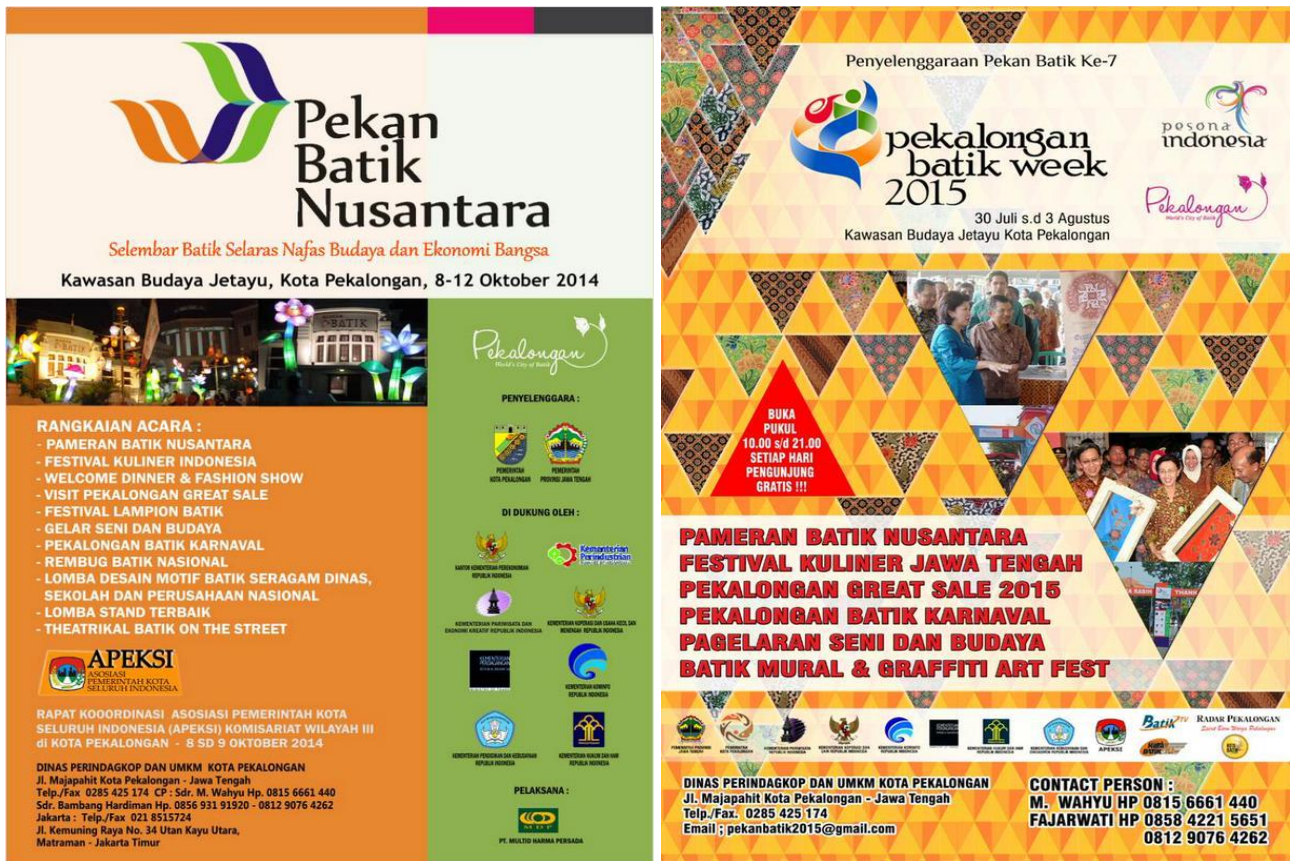
Gambar 4. Pekan Batik Nusantara 2014 dan Batik Week 2015 yang diselenggarakan di Kota Pekalongan

pengusaha batik juga melakukan usaha proaktif dengan menjalin kerkasama dengan manajemen hotel agar dapat mengarahkan tamu-tamu hotel untuk mengunjungi sentra-sentra batik di Pekalongan, terutama kampung batik.