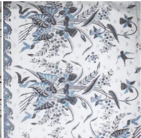
Buketan Biru Putih Belanda