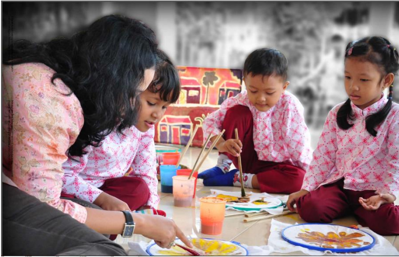
Siswa TK belajar menggambar dengan menggunakan media kain