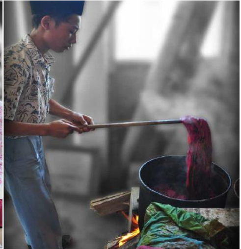
Siswa SMP belajar pewarnaan pada kain batik