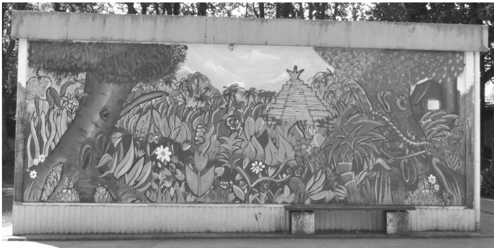
Abb. 1: Vorderseite des Pavillons

Auf der dem Schulhof zugewandten, somit vorderen Seite des Pavillons wird eine über- wiegend grüne Fläche mit diversen farblichen Akzentuierungen sichtbar, die strukturelle Ähnlichkeiten mit einem dichten Wald im Sinne des tropischen Regenwalds („Dschungel“) oder einem verwilderten Garten aufweist (s. Abb. 1).