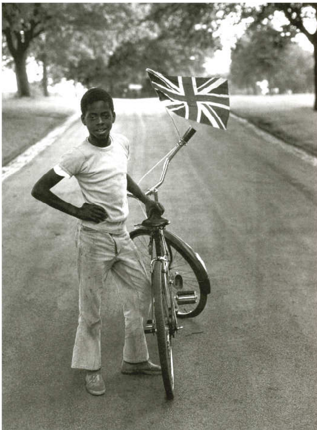
Vanley Burke: Boy with Flag (1977) (Hall/Sealy 2001: 32)

Im Laufe der 80er Jahre kamen andere Formen der künstlerischen Repräsentation dazu. „There was a greater recognition of the internal complexities of their situation by black and other non western artists, in whose lived experience several axes of difference – race, gender, class, sexuality and ethnicity – now overlapped“ (Hall/Sealy 2001: 15). Die folgende Einschätzung Halls zum Selbstbewusstsein dieser neuen Generation bezieht sich nicht ausdrücklich nur auf Künstler: „Junge schwarze