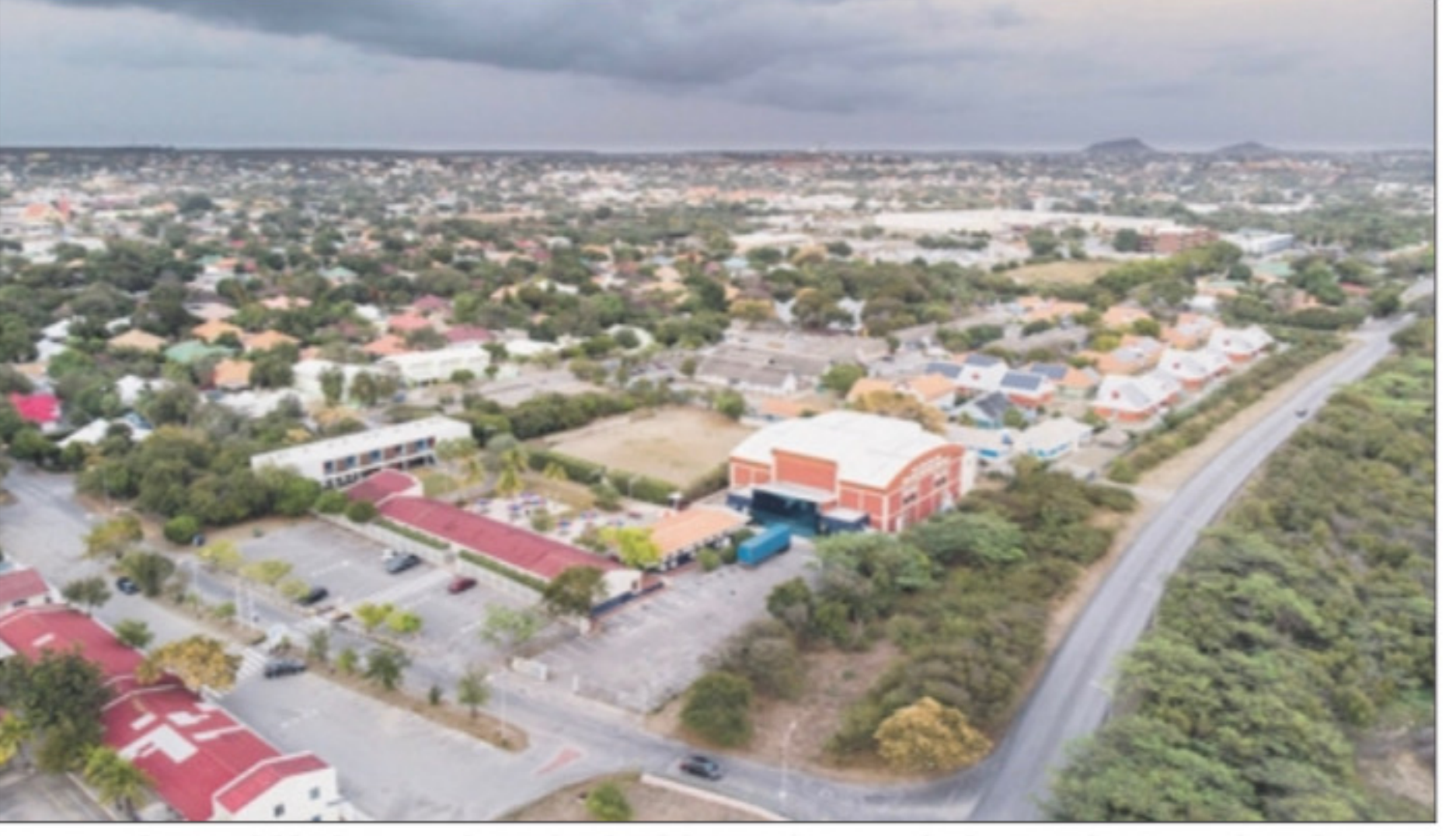
"Wat zijn de mogelijkheden voor de Caribische delen van het Koninkrijk om in deze veranderende omgeving gebruik te maken van meer ruimte voor variëteit?"

toekomst gericht denken, amper bewaarheid. De mentale blokkades zitten diep. Ze betreffen zowel de inrichting van het Koninkrijk als die van de EU. Intussen staan de gebeurtenissen niet stil.