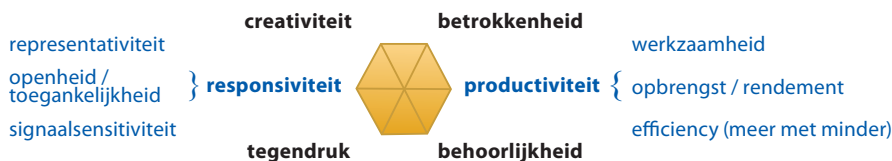
Figuur 1 Leidende beginselen: responsiviteit en productiviteit

niet alleen van en door, maar ook for the people dient te zijn. 9 Een bestuur dat aan de voorkant geweldig representatief, open en sensitief is, maar aan de achterkant weinig oplevert – in termen van openbare orde, veiligheid, welvaart, ruimtelijke ordening, infrastructuurontwikkeling, enzovoort – of alleen tegen disproportioneel hoge kosten, schiet uiteindelijk toch tekort.