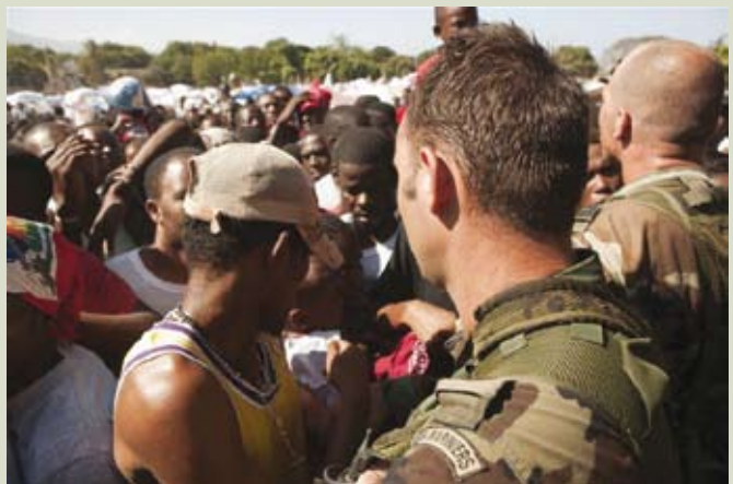
Mariniers proberen menigte in bedwang te houden