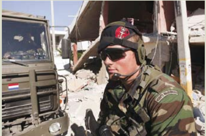
Nederlandse marinier tussen puinhopen op Haiti