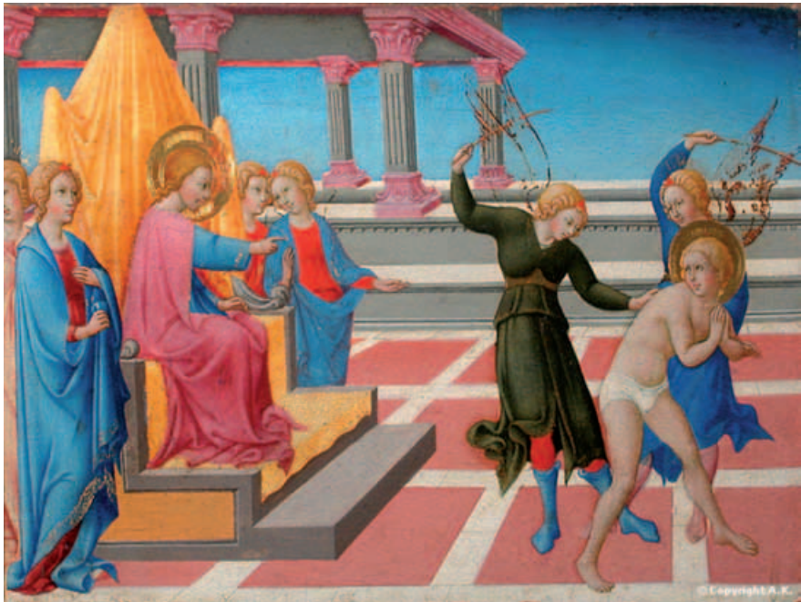
De geseling van St Hiëronymus

Al in een vroeg werk, de Vita Pauli , vertelt hij hoe de negentigjarige monnik Antonius gewaarschuwd door een droom de veel oudere Paulus moet opzoeken, vlak voordat deze sterven zal. In een ander vroeg werk, de Vita Hilarionis 3,7-12, beschrijft hij hoe een arme monnik gedurende de nacht in allerlei vormen demonen op visite krijgt. Ook in zijn brieven verwijst Hiëronymus naar droomverslagen. In Ep. 24 schrijft hij over een vader die voor de geboorte van zijn dochter droomt over een kristallen schaal. De kristallen schaal in de droom zou een verwijzing zijn naar haar toekomstige leven als maagd. En in Ep. 107, 5,2 vertelt Hiëronymus over een droom die Praetexta, de tante van Eustochium gehad heeft nadat zij het haar van haar nichtje geprobeerd had te fatsoeneren. In de nacht komt een engel met een lelijk gezicht zeggen dat haar handen zullen verschrompelen en dat ze vijf maanden later zal sterven. Hiëronymus vertelt vervolgens dat dat ook gebeurt.