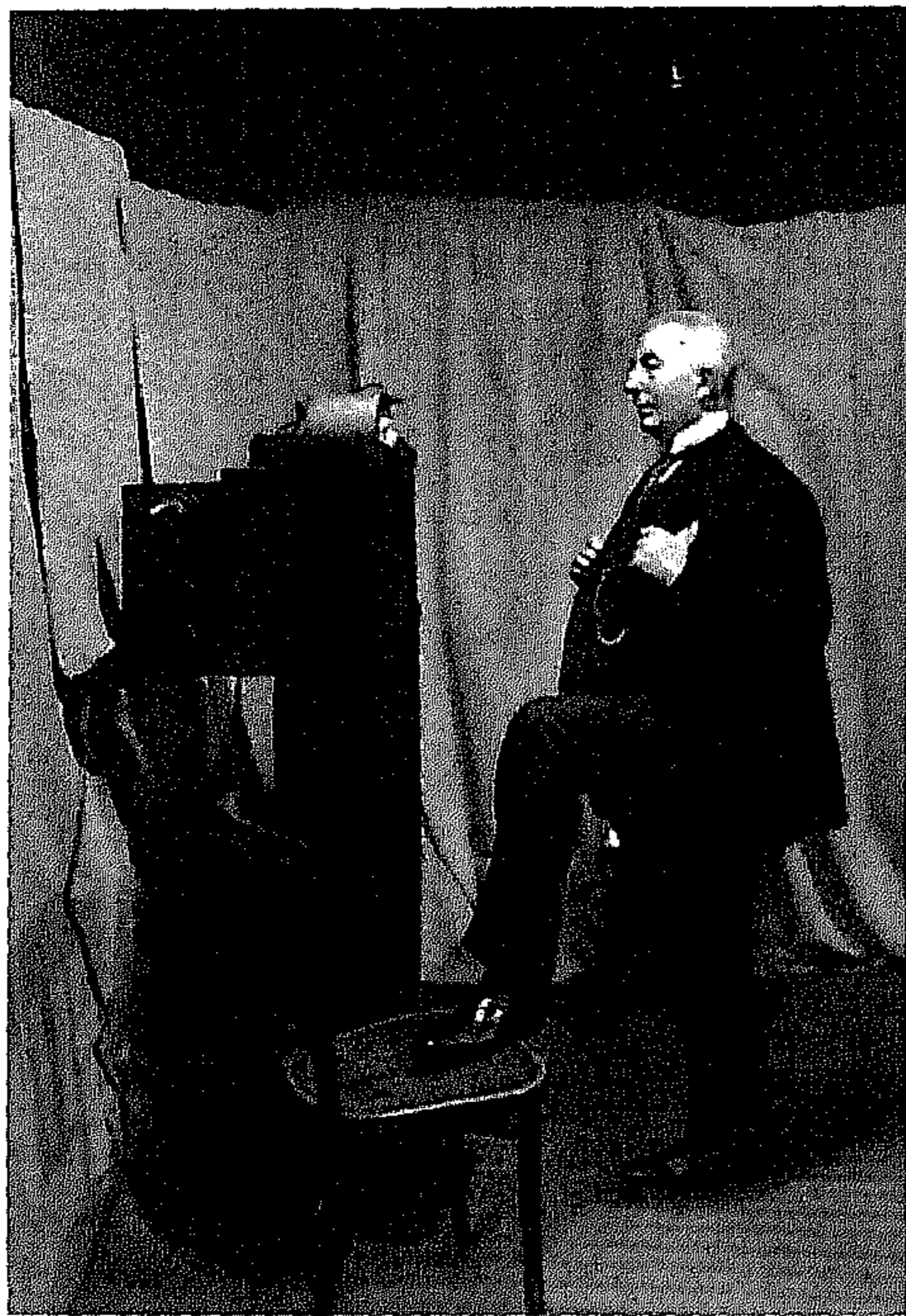
H. Colijn in 1924 voor de microfoon

Nederland. “Er is voorshands geen enkele reden om ongerust te zijn”, verklaarde de voorman van de Antirevolutionairen voor de radio ten tijde van de Duitse Einmarsch in de gedemilitariseerde zone van het Rijnland in maart 1936; Nederland kon rustig naar bed, het leger naar de kazerne. Een karakteristieke foto van Colijn laat zien hoe hij tijdens een radiotoespraak zijn linkerbeen pontificaal op de zitting van een stoel heeft geparkeerd, terwijl hij, de borst vooruit, zijn duimen heeft ingehaakt in de mouwsopeningen van zijn kostuumvest. Helemaal de pose voor een monument. Dit was in 1924, toen hij als Minister van Financiën op 27 juni voor de microfoon van de Hilversumsche Draadloze Omroep (de voorloper van de AVRO) het woord voerde over