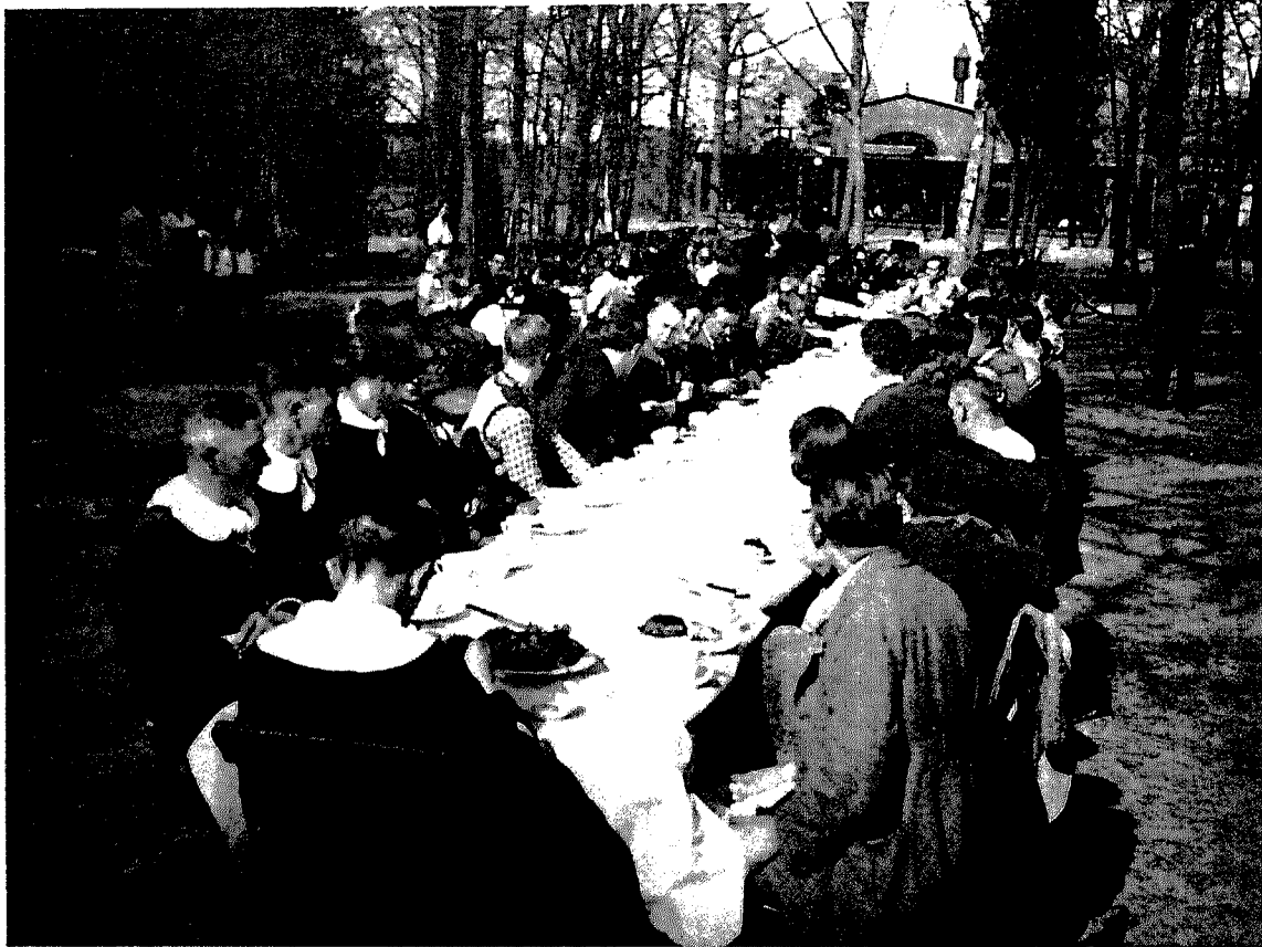
Afb. 5 De Brabantse koffietafel, symbool van de Brabantse gastvrij- heid en het Brabantse saamhorigheidsgevoel? Foto van een koffietafel in de openlucht in Oisterwijk.