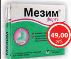
МЕЗИМ ФОРТЕ таблетки x20