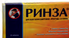
РИНЗА таблетки x10

Цены действительны с 04.09.2014г. по 08.10.2014г.