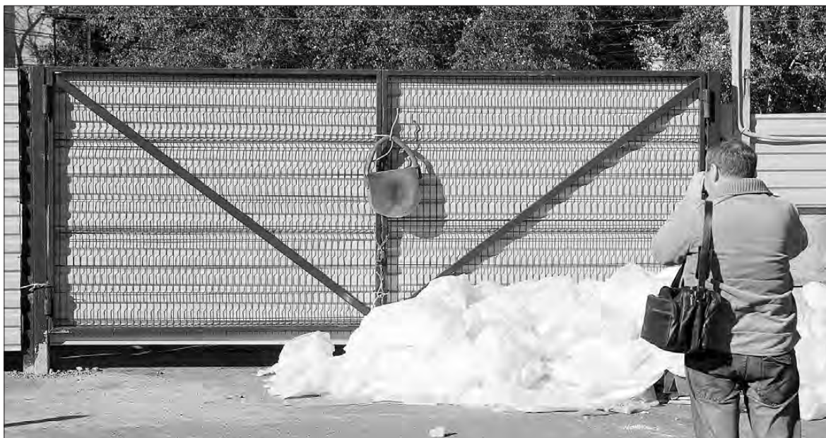
На воротах забора висит огромный бутафорский замок – символично, иронично, в духе актерских капустников.

Людмила ПОГОДИНА.