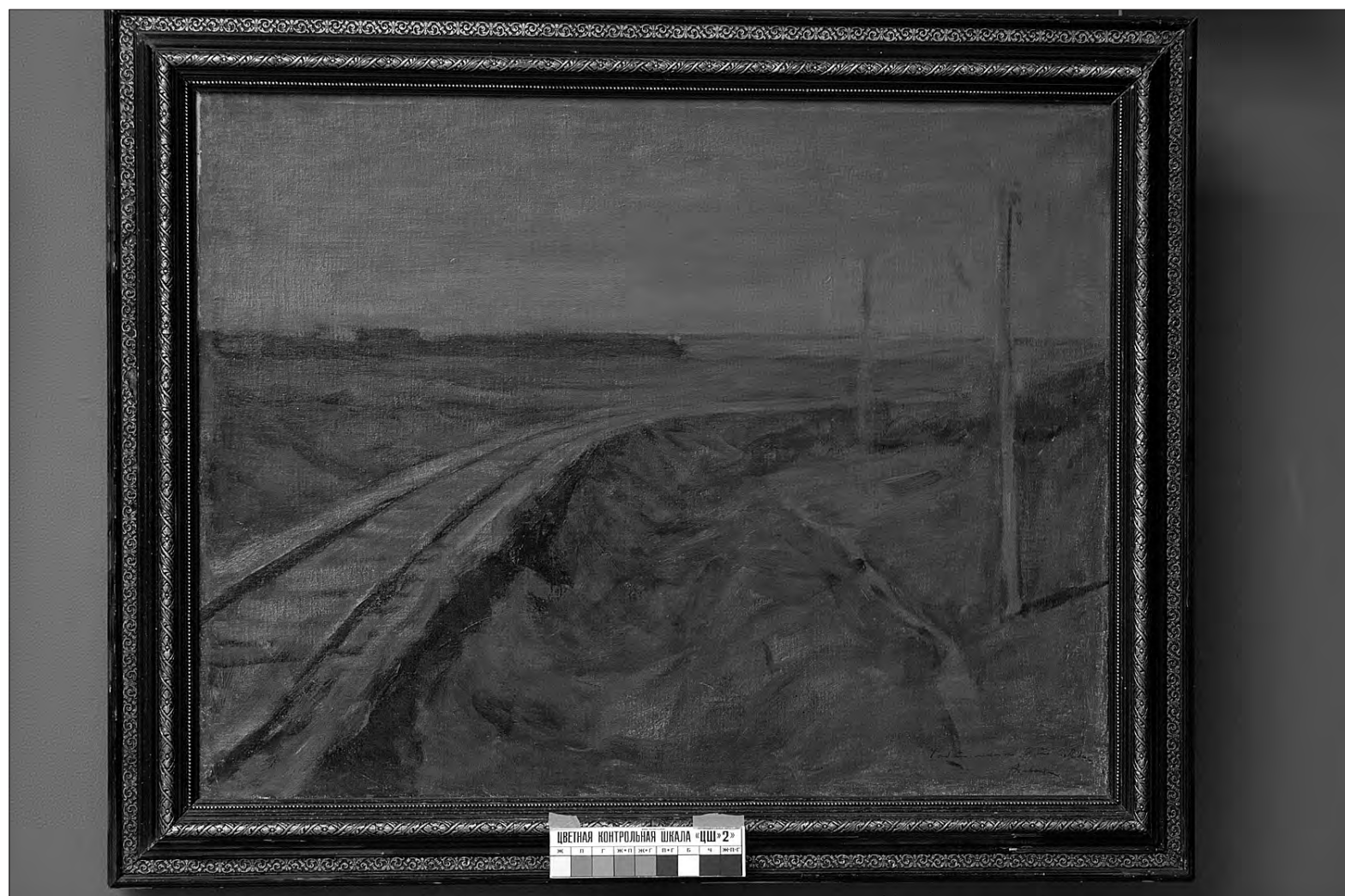
«Полотно железной дороги», И. Левитан.