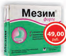
МЕЗИМ ФОРТЕ таблетки x20