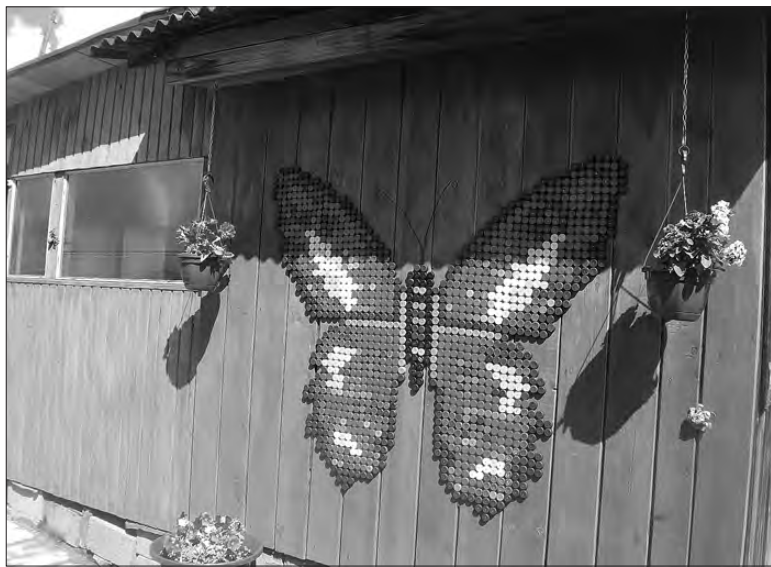
«Бабочка» из пробок.