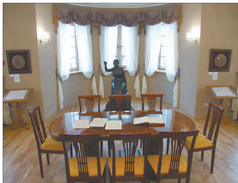
Интерьер тоже красив.

В день открытия сотрудники музея провели первую экскурсию. На первом этаже усадьбы