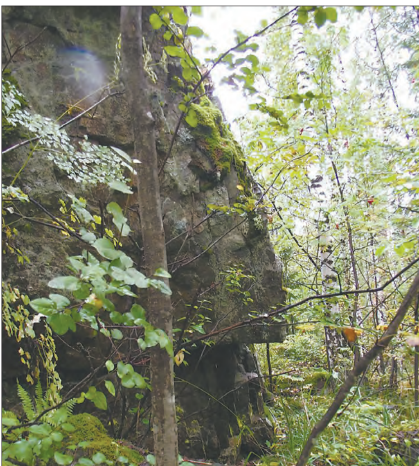
На скале словно профиль человека из камня вытесан...