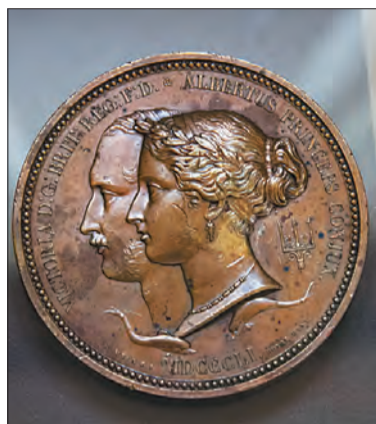
Одна из медалей экспозиции.

Район, где находится усадьба, на карте 1843 года обозначен как «Матильдино предместье». Это название дано в честь супруги Анатолия Демидова, принцессы Матильды де Монфор, племянницы императора Наполеона Бонапарта. При строительстве дачи был удачно использован рельеф местности. Со стороны дороги (ул. Красногвардейская) она выглядит одноэтажной. С трех других сторон имеет два этажа. На чертеже 1876 года, названном «План и фасад дачи Павла Павловича Демидова, князя Сан-Донато,