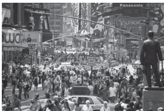
Dimension Gestalt und Atmosphäre