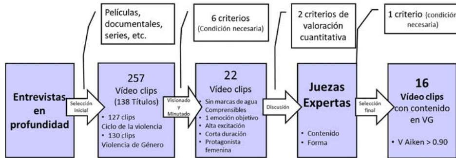
Figura 3. Procedimiento para la selección de estímulos audiovisuales relacionados con la Violencia de Género a través de personas expertas en el ámbito.

En primer lugar, con el objetivo de conocer cuáles son los audiovisuales que mejor reflejan las situaciones de violencia contra las mujeres, bien por ser empleados por profesionales en las terapias y/o talleres de sensibilización, bien por ser referidos por las mujeres durante las sesiones de terapia, se realizaron 14 entrevistas semiestructuradas grupales y 20 individuales, con un total de 59 personas participantes -siendo en su mayoría mujeres (56)-. El trabajo de campo fue llevado a cabo entre octubre de 2018 y agosto de 2019, en el área geográfica de la Comunidad de Madrid (España), ámbito al que está circunscrito el proyecto. Las entrevistas tuvieron lugar en 16 municipios diferentes (incluida la capital), la mayor parte de los cuales pertenecen al área metropolitana de Madrid, pero prestando atención también a la problemática específica de las zonas rurales. Las personas entrevistadas (N=59) pertenecen a 18 equipos de los Puntos de Atención a Mujeres Víctimas de Violencia de Género, a 6 organizaciones de la sociedad civil que trabajan con estas víctimas y a la Unidad de Familia y Mujer de la Policía Nacional. El perfil profesional de las personas entrevistadas era también diverso: Coordinación (n=11; 18,64%), Policía (n=5; 8,47%), Psicología (n=22; 37,29%), Derecho (n=5; 8,47%), Educación Social (n=3; 5,08%), Trabajo Social (n=9; 15,25%) y Equipo Directivo (n=4; 6,77%).