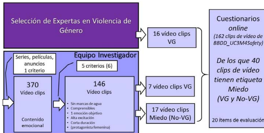
Figura 2. Procesamiento de materiales audiovisuales en el proceso de selección de un conjunto equilibrado de clips de vídeo para base de datos audiovisuales BBDD_UC3M4Safety.