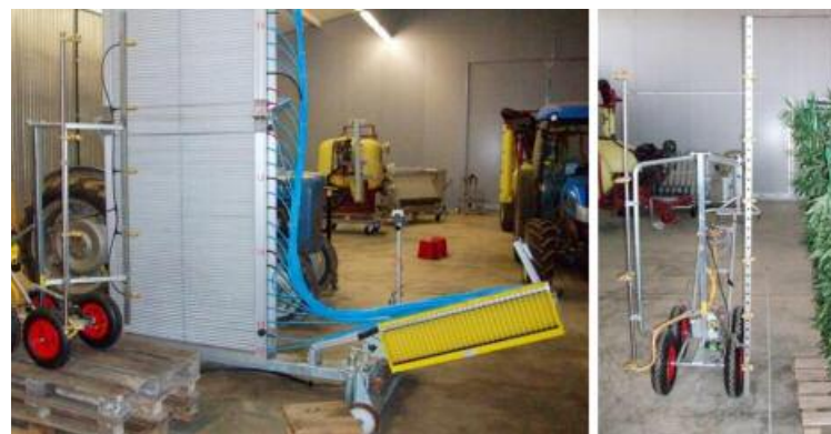
Figura 1: Determinación de la distribución vertical (izquierda) y evaluación de la deposición de la pulverización en vegetación artificial (derecha).

Para evaluar cómo se distribuye el líquido y la capacidad de penetrar en el interior del cultivo se ha utilizado un tramo de vegetación artificial de 2 m de largo y 1,8 metros de alto de media, y con una anchura media de 0,4 m. En ella se han colocado papeles hidrosensibles situados a tres alturas distintas, tanto en el interior de la vegetación como en las dos caras exteriores. Para evaluar el recubrimiento, los papeles se han analizado con el software Image J. Se entiende el recubrimiento como la proporción de papel hidrosensible que ha sido mojado (color azul) respecto a la parte seca (color amarillo). La valoración de la penetración en la vegetación se ha realizado mediante un índice de penetración. Este índice pretende valorar qué porcentaje de toda la cantidad aplicada en la vegetación es recogido en el interior. En una aplicación ideal, del 100% aplicado, se pretenderá recoger un 33% en la cara exterior derecha de la vegetación, un 33% en la cara exterior izquierda y un 33% en el interior.