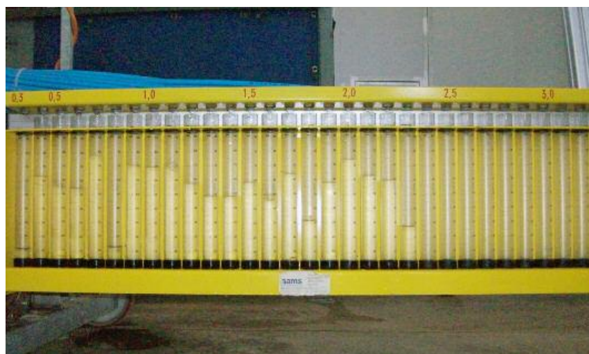
Distribución del líquido con boquillas cónicas ATR.

Se ha determinado el perfil de distribución mediante un banco de distribución vertical (AMMS, Maldegem, Bélgica) (Figura 1). Este banco permite recoger el líquido pulverizado hasta una altura máxima de 3,5 m cada 0,1 m.