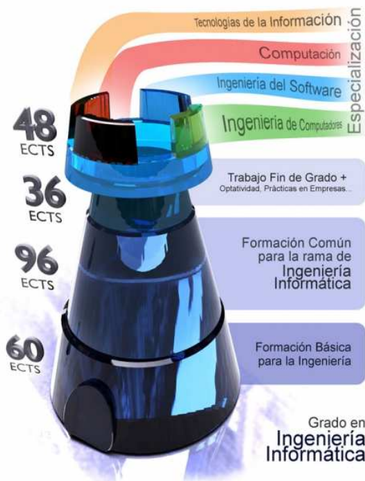
Figura 2: Estructura del Plan de Estudios de la ESI.