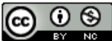
Figura 7.1. Llicència Creative Commons de reconeixement i no comercial

En aquest cas s'ha decidit la llicència de “Reconeixement-NoComercial”, que permet a qualsevol persona mesclar, adaptar i crear a partir de la vostra obra sense finalitat comercial. I les seves noves obres derivades, tot i que han de reconèixer-vos i no poden ser utilitzades comercialment, no han d'estar subjectes a una llicència amb els mateixos termes que l'obra original.