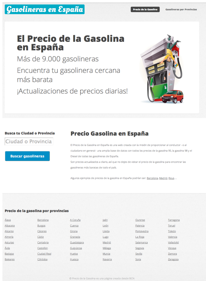
Figura C.1 - Captura de pantalla de la página principal

En aquest annex s'inclouran les captures de pantalla de l'aplicació web http://preciodegasolina.es dissenyada i implementada que s'explica a la memòria.