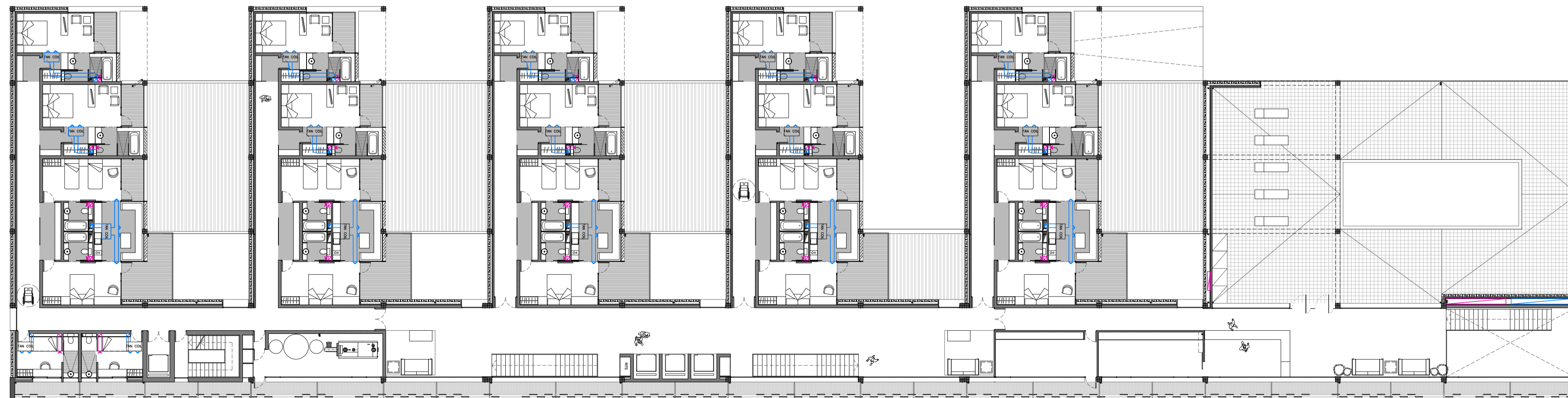
CLIMATITZACIÓ PLANTA SEGONA e 1:200