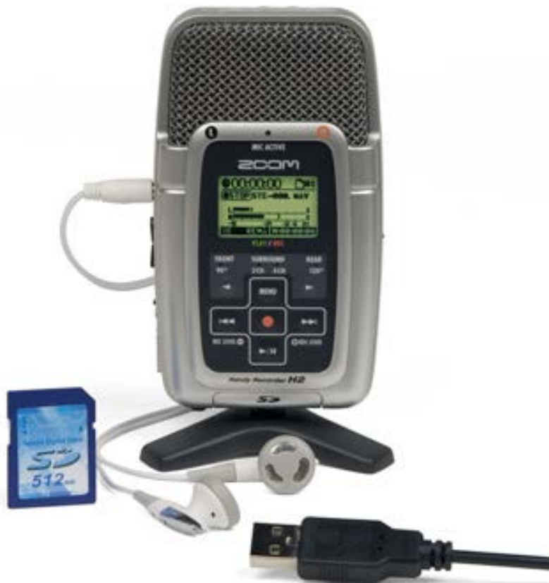
Gravadora Zoom 2H

Un model que és apropiat per obtenir gravacions estèreo de qualitat és la gravadora Zoom Handy Recorder 2H, que es pot trobar fàcilment a llocs web com Amazon per un preu d'uns 150€. En aquest enllaç podem trobar el seu manual d'ús: http://www.zoom.co.jp/downloads/h2/manual/