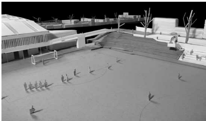
Fig. 7. Conjunto Tirrases (Centro Deportivo). Luis Diego Barahona.