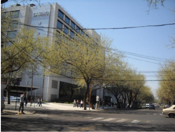
4- Mendoza, calle Sarmiento 2012