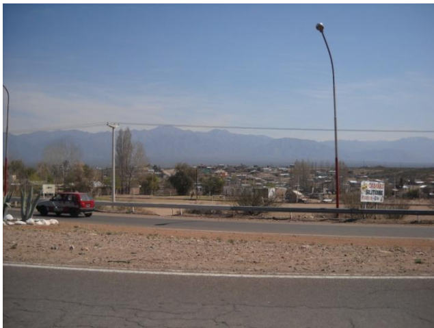
3- Mendoza, Frente opuesto al Barrio Palmares, Corredor del Oeste.2012