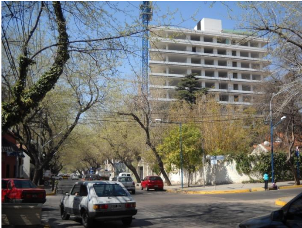
2- Mendoza, Barrio Bombal. 2012