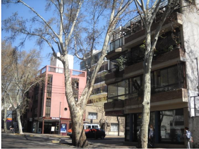
7- Microcentro, ciudad de Mendoza, 2012