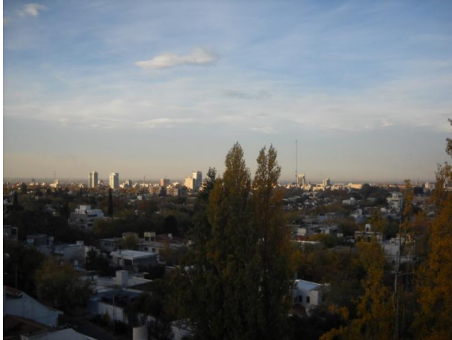
1- Los costos del boom inmobiliario. Mendoza. 2012.