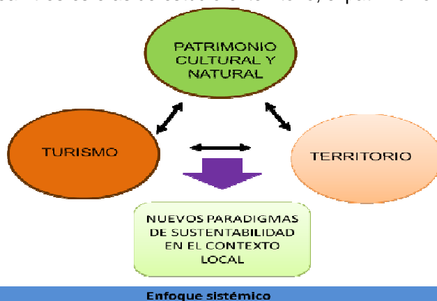
Imagen 1. Esquema de abordaje metodológico.

El concepto de patrimonio cultural de acuerdo con García López (2008), surge de la relación a dos funciones claras de carácter social y político: cohesión social e identidad social. A estas funciones se añade posteriormente un abierto carácter económico, al convertirse en un bien de consumo demandado por el turismo. Para el abordaje metodológico se ha contemplado el enfoque de sistemas, el cual permite abordar el problema de la identificación del patrimonio cultural basada en la noción de totalidad y sus componentes (Guerrero, 2011). Por tanto se plantean tres esferas de estudio el territorio, el patrimonio cultural y el turismo.