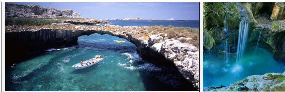
Foto 1 y 2 de las Islas Marietas.

En el proceso de la investigación se aplicaron 2 encuestas, una en 2011 y otra en 2013 para conocer cuáles son los lugares y espacios representativos que la población local identifica. La encuesta proyecta datos muy interesantes, ya que el espacio público más representativo eran las plazas cívicas de cada localidad y el malecón en el caso de Puerto Vallarta. En cuanto a los espacios naturales la población identifica tres lugares representativos: la playa, la montaña y el río. Los pobladores locales además de reconocer los lugares de playa, tienen una relación muy estrecha con el río y la montaña, ya que son lugares públicos donde aún preservan costumbres y actividades de esparcimiento familiar en el campo. Lugares que reconocen como propios, ajenos de la agitación turística concentrada en el litoral.