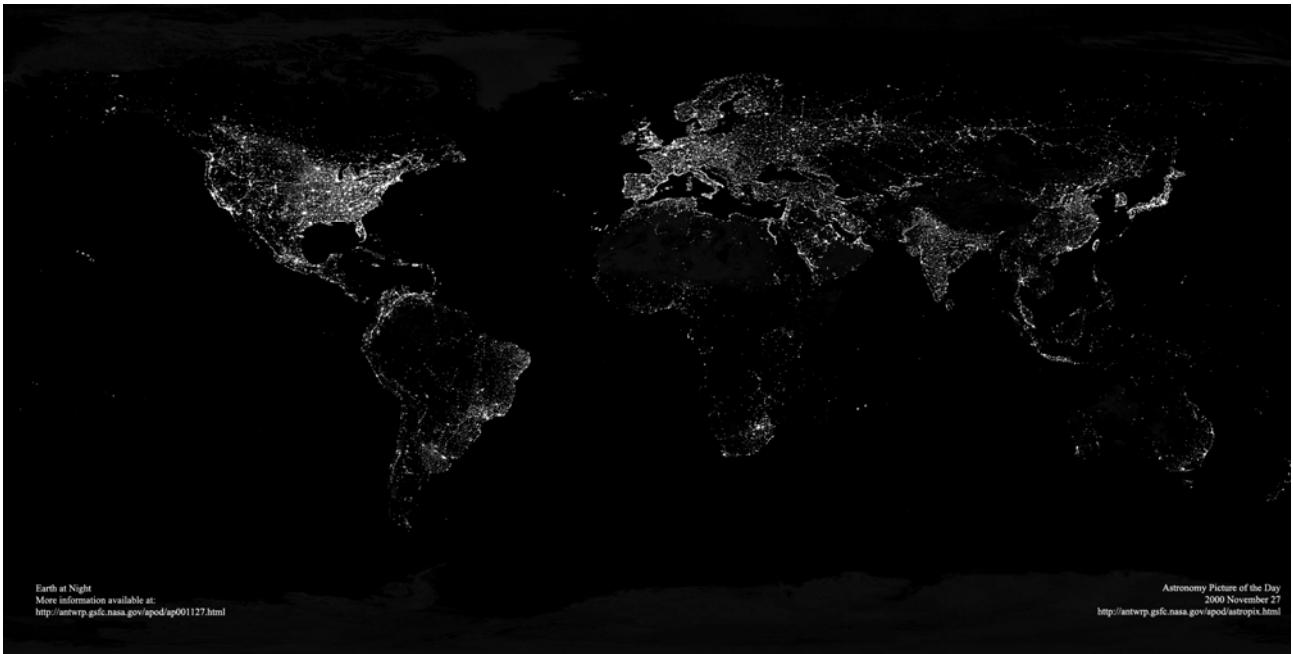
Astronomy Picture of the Day, dnb_land_ocean_ice.2012.3600x1800.jpg ( http://apod.nasa.gov/apod/image/1212/dnb_land_ocean_ice.2012.3600x1800.jpg )

Constelar en el sentido representativo, en la construcción de una imagen metonímica, mediante la cual interpretar o evidenciar la forma de las relaciones en el territorio 2 . Un desarrollo planteado desde una mirada disciplinar, la del ejercicio de arquitecto. Si bien se parte de enunciados externos a esta disciplina, estos se transforman rápidamente en excusas para analizar, diagnosticar y proyectar el territorio.