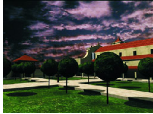
Figura 2 - Redução de São Miguel Arcanjo - RS/Brasil – Vista del cementerio - Recorridos.