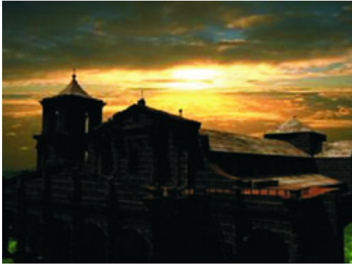
Figura 1 – Redução de São Miguel Arcanjo – RS/Brasil – Vista de la Iglesia en el amanecer.