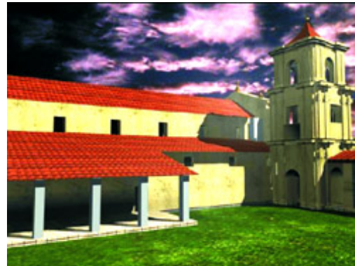
Figura 4 - Redução de São Miguel Arcanjo - RS/Brasil - Vista del patio interior de la casa de los padres e de los talleres.