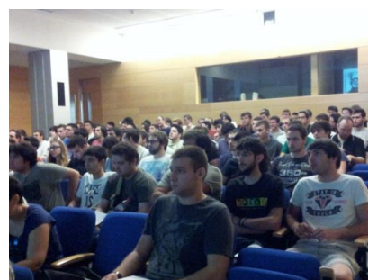
Figura 1: Instantes de la primera parte de la visita