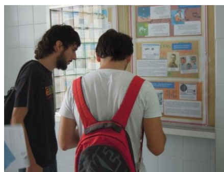
Figura 2: Visita autoguiada mediante el cuestionario

A continuación se muestran las cuestiones que integran uno de los cuatro cuestionarios que se facilitaron a los alumnos para responder durante el recorrido a lo largo de la exposición permanente del museo: