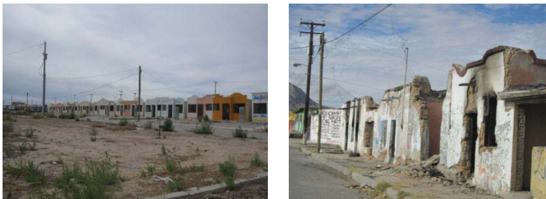
Figura 1: Imágenes de vivienda abandonada en la Colonia La Chaveña (izquierda) y en el Fraccionamiento Villas del Sur (derecha) en Ciudad Juárez, Chihuahua.