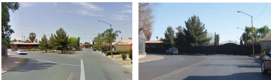
Figura 2: Imágenes del confinamiento de un área residencial dentro del fraccionamiento El Campestre, en Ciudad Juárez, Chihuahua.

Como resultado de esta práctica de confinamiento, tanto el flujo vehicular como el peatonal se han tornado conflictivos por el cierre de calles que, además, dejan dentro no sólo viviendas, sino equipamiento urbano como parques, jardines, escuelas, guarderías, ocasionando molestias a los ciudadanos propios y ajenos a los sectores confinados. En la Figura 2 se muestran imágenes de la obstrucción de una vialidad en un fraccionamiento residencial. A la izquierda se puede observar la imagen obtenida a través de Google Earth (2009) y la izquierda corresponde a la actual.