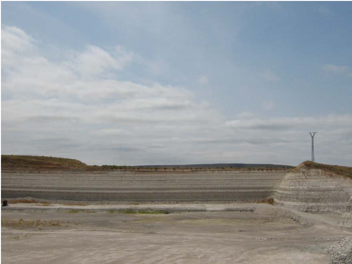
Explotación de sepiolita en Ruesca

También, en la actualidad, hay una actividad minera importante dedicada al beneficio de la Sepiolita, que se extrae fundamentalmente por los alrededores de las poblaciones de Mara, Orea y Ruesca.