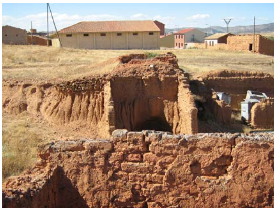
Hornos de tejas de Cetina

Otro caso podría ser el de los MOLINOS DE POLVORA DE VILAFELICHE , en donde hay restos de muchos de ellos, así como uno de reconstruido. Al respecto, cabe decir que en la actualidad ya son motivo de visitas turísticas.