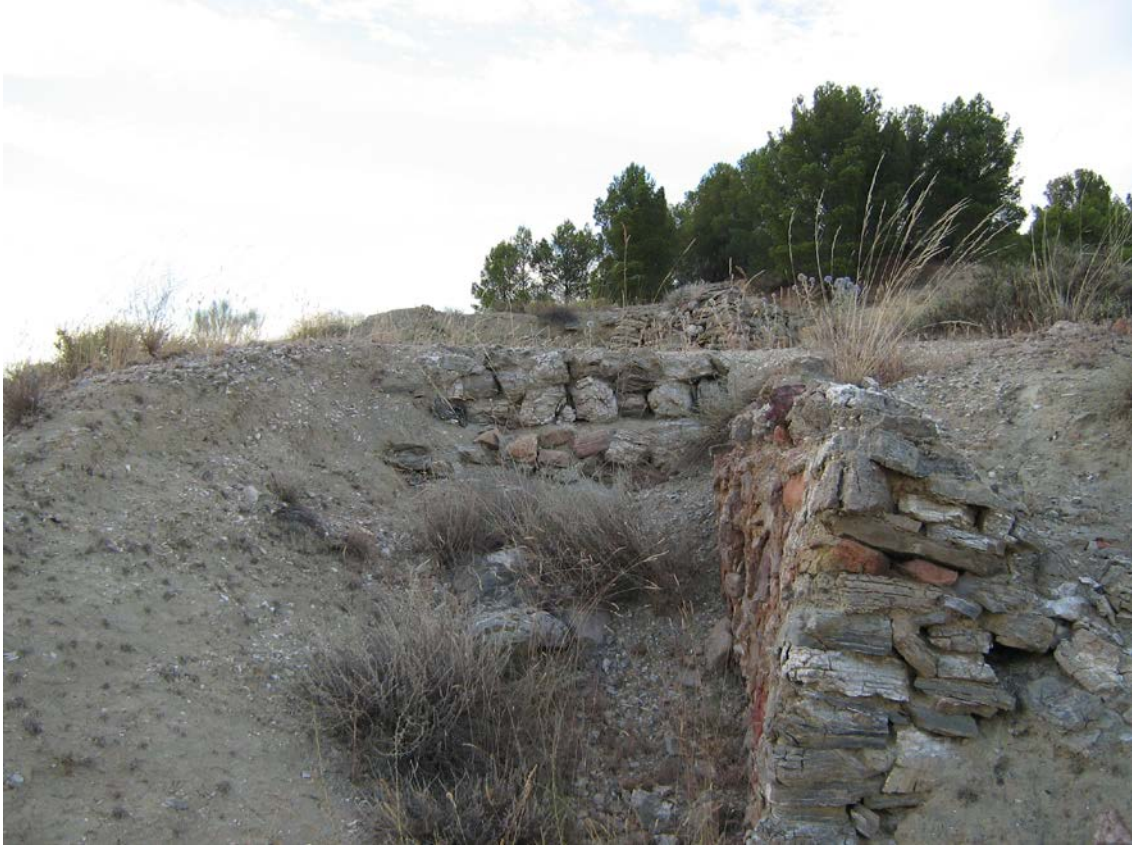
Uno de los hornos de yeso de Nuévalos

Por otra parte, cerca de los hornos (a unos 3 Km) se hallan también las conocidas Salinas de Nuévalos .