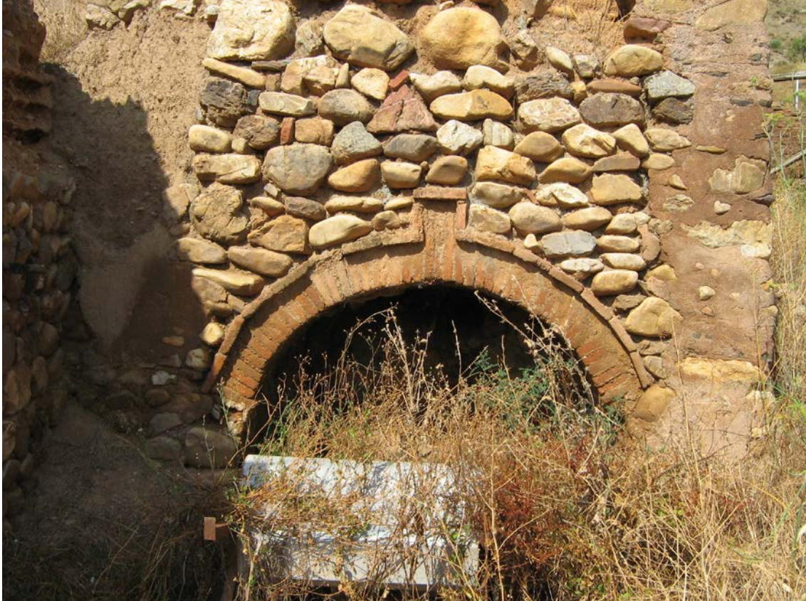
Uno de los hornos de alfarería de Tobed

En este caso, cabe considerar los distintos hornos de alfarería situados en distintos lugares de la población. Se trata de un conjunto relativamente conservado de 5 hornos. En ellos se utilizaban unas arcillas cuaternarias de depósitos de piedemonte.