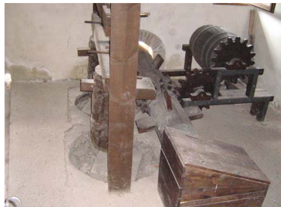
Molino de pólvora reconstruido, Vilafeliche