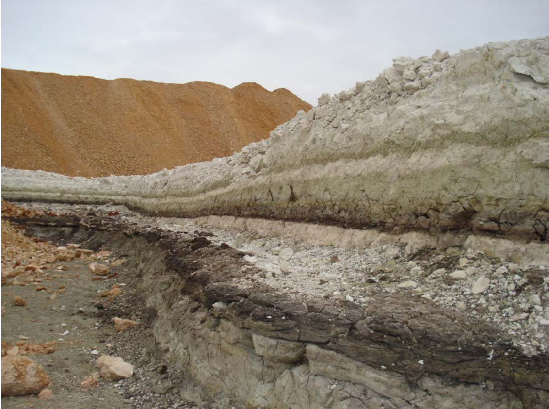
Detalle de la explotación en Ruesca

Por lo que concierne al Patrimonio Minero generado, al tratarse de explotaciones relativamente recientes, creemos que es muy pronto para valorarlo. En todo caso se relaciona exclusivamente con las propias explotaciones y con la planta de tratamiento.