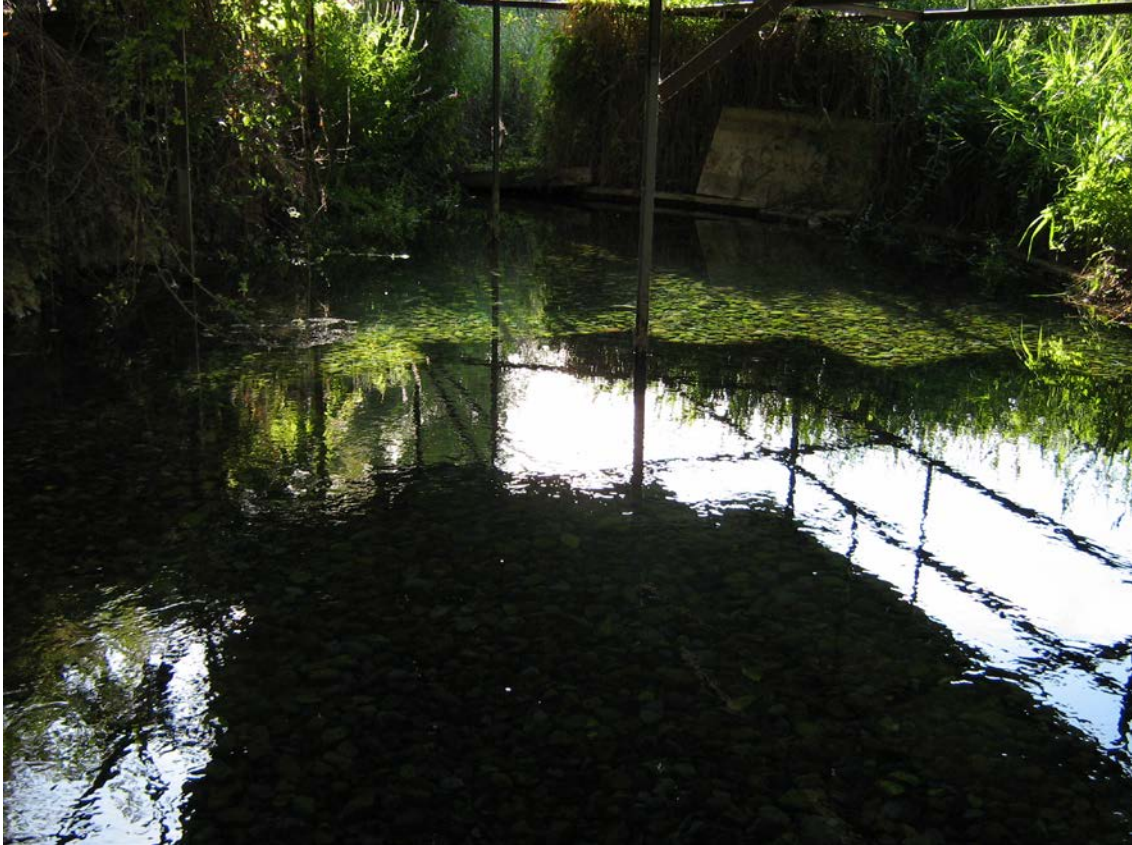
Un aspecto antropizados de la surgencia de Cimballa

Así, otro elemento importante a resaltar lo constituye la surgencia de Cimballa , cuya muestra es: