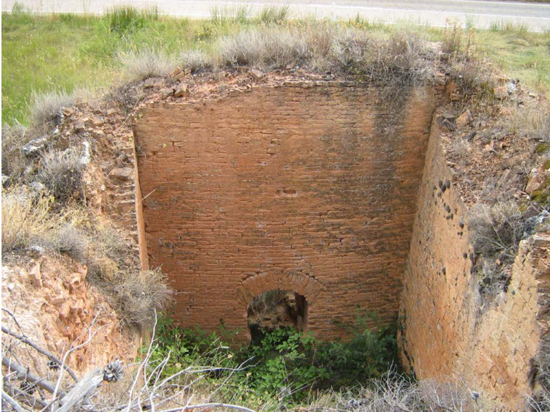
Uno de los tejares de Alhama de Aragón

Se trata de un interesante conjunto de hornos de cal y de hornos de tejas , situados en las cercanías de Alhama de Aragón, junto al viejo trazado de la carretera nacional N-2