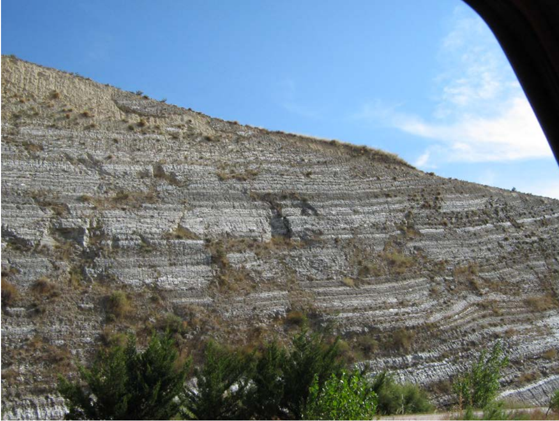
Yesos miocénicos en las cercanías de Calatayud

En relación con el patrimonio minero , cabe mencionar el relacionado con los hornos de yesos , que se sitúan en Calatayud, Belmonte de Gracían y en Nuévalos (estos, entre los afloramientos de los yesos triásicos del Keuper).