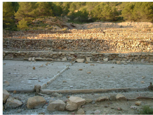
Dos aspectos de las eras de las Salinas de Nuévalos

Cabe decir que en conjunto constituyen unos elementos muy valiosos del patrimonio minero , con un indudable potencial turístico.