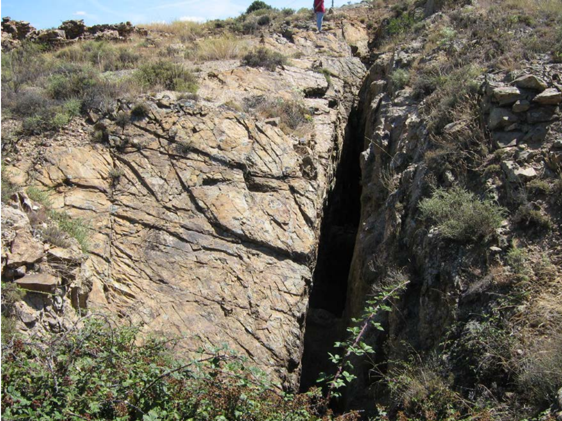
Restos de las explotaciones mineras en Valdesancho (Munébraga)

Al respecto de estas mineralizaciones, creemos necesario efectuar un estudio en profundidad de los diferentes indicios, de cara a delimitar sus posibilidades, especialmente teniendo en cuenta el alza del mercado de los metales.