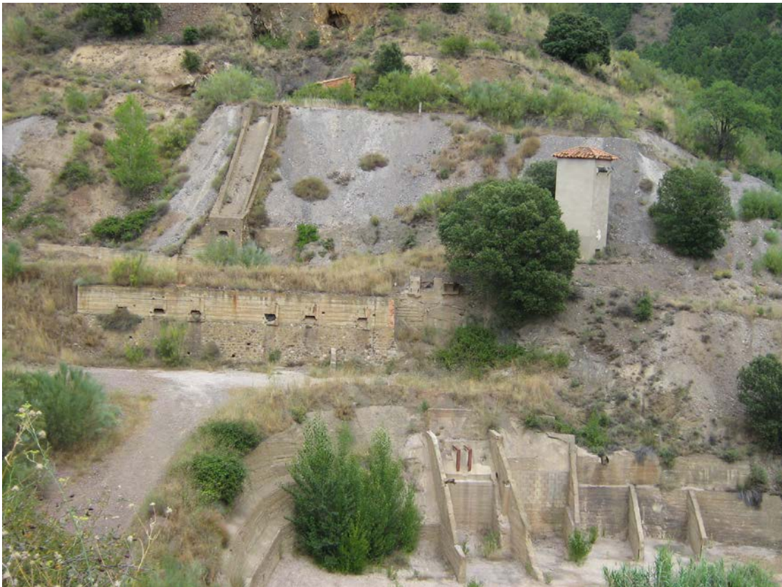
Sistemas de tolvas de las minas de baritina de Tobed

En cuanto al patrimonio minero generado por estas explotaciones, cabe decir que no es muy importante, limitándose a los restos de las propias labores mineras. Sin embargo, cabe mencionar el relacionado con los sistemas de tolvas de las minas de baritina de Tobed.