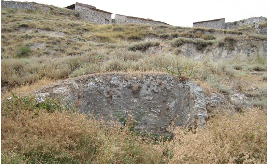
Uno de los hornos de yeso de Belmonte de Gracián