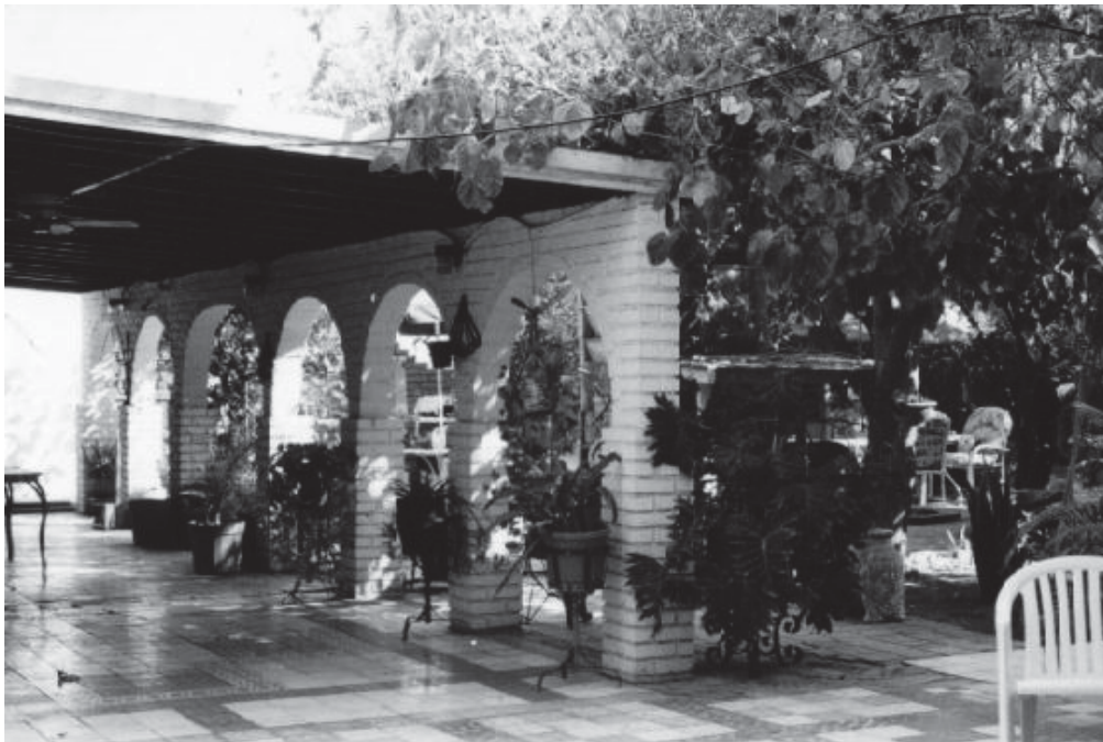
Figura 4: Caso de estudio donde se integra la cochera al patio como área de estar cubierta.