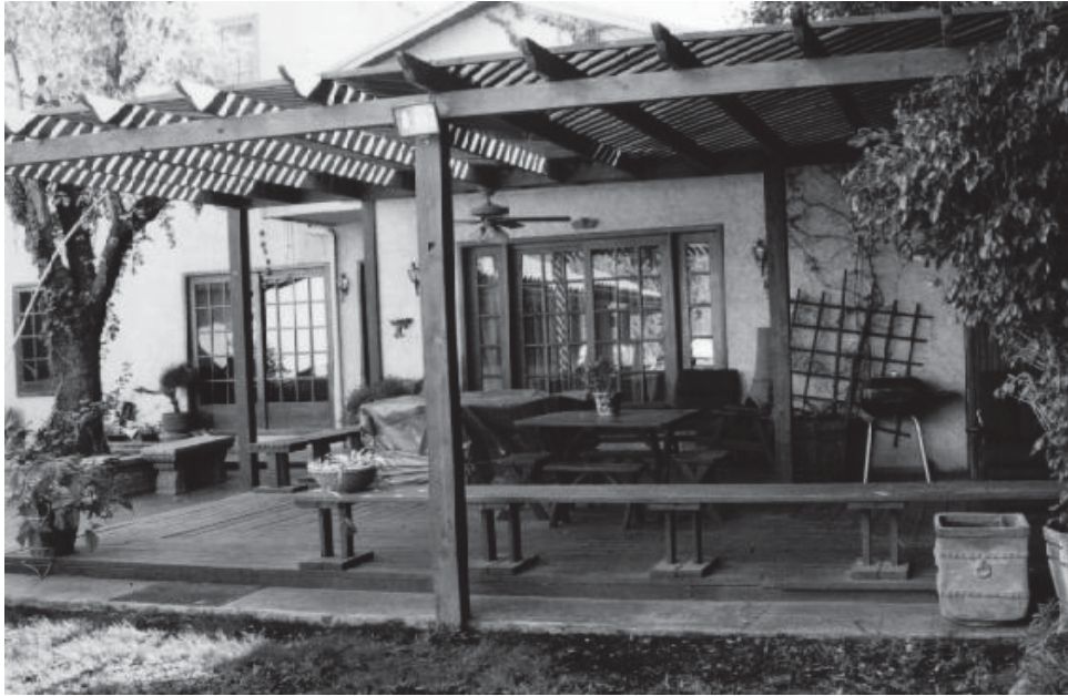
Figura 5: Caso de estudio donde se integra al patio una terraza.