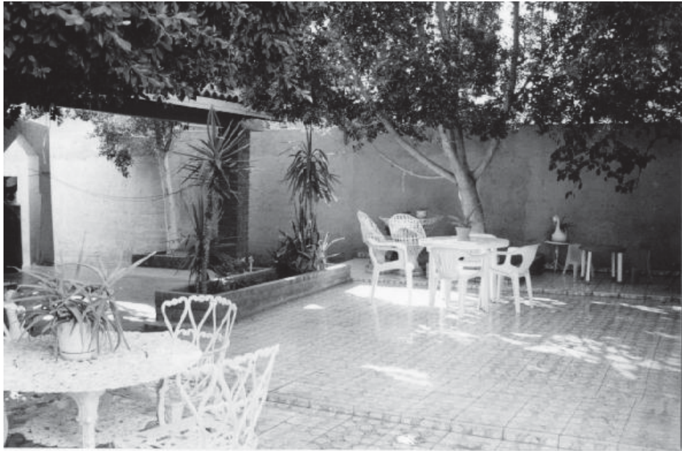
Figura 3: Caso de estudio donde se comparte el patio por dos viviendas que se localizan una con frente hacia la calle y otra hacia el callejón.

tampoco podemos hablar que exista un concepto de patio como en el interior del país, donde las habitaciones giran en torno a un patio central. En esta ciudad podemos decir que se ha dado este concepto diferente, donde el espacio exterior de las viviendas se fusiona con elementos como el pórtico, las áreas verdes y la cochera, donde se conjuga el juego de los niños con las convivencias en torno a la carne asada.