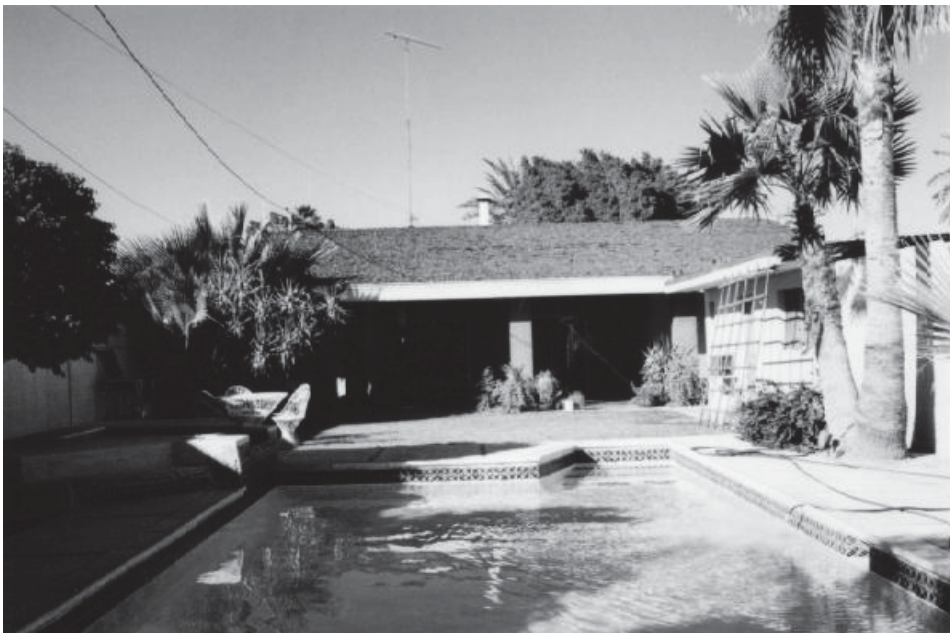
Figura 6: Caso de estudio donde se integran al patio una alberca, terraza cubierta como área de estar y un asador.