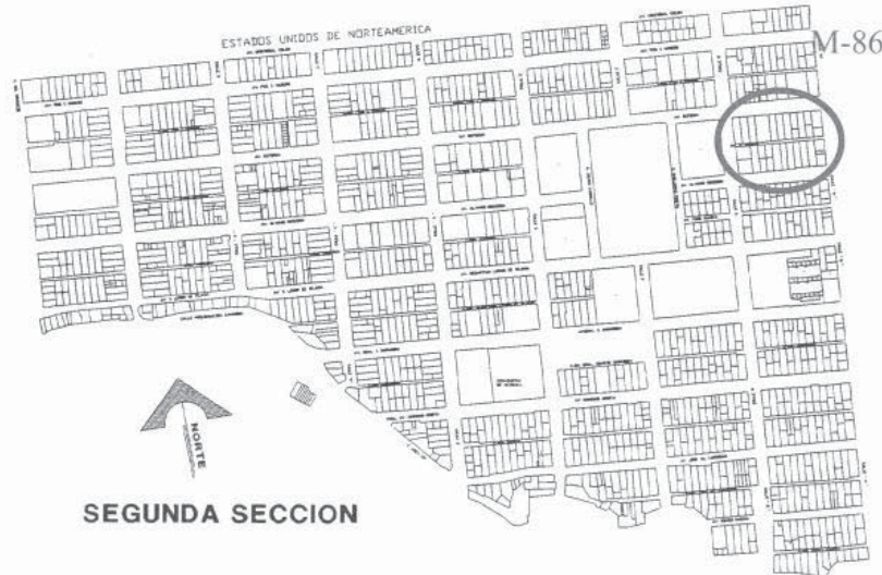
Figura 2: Segunda Sección de la ciudad de Mexicali y localización demanzana de estudio.

constituyen los 20 casos de estudio. Estos se localizan a dos cuadras de la línea internacional entre México y los Estados Unidos de América. Para la recolección de datos se realizó una encuesta a los usuarios, un levantamiento físico, perceptual, fotográfico y de vegetación de cada uno de los patios de la muestra, además de la información catastral, de usos de suelo y características del contexto.