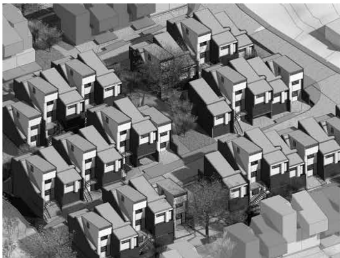
Figura 8: Imagen aérea de los microbarrios y vista de los espacios públicos centrales.