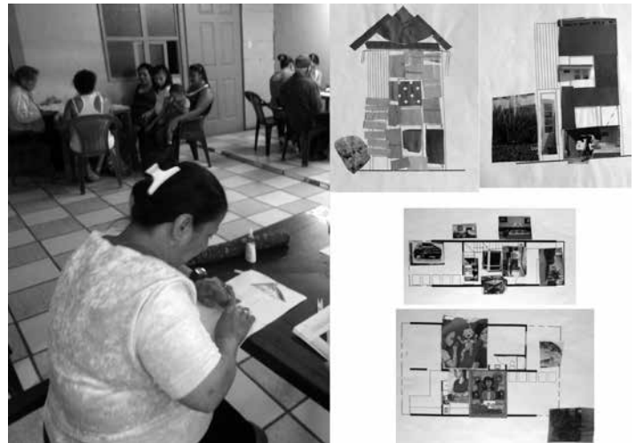
Figura 7: Trabajos realizados en uno de los talleres con el fin de favorecer un proceso de apropiación por parte de las participantes.