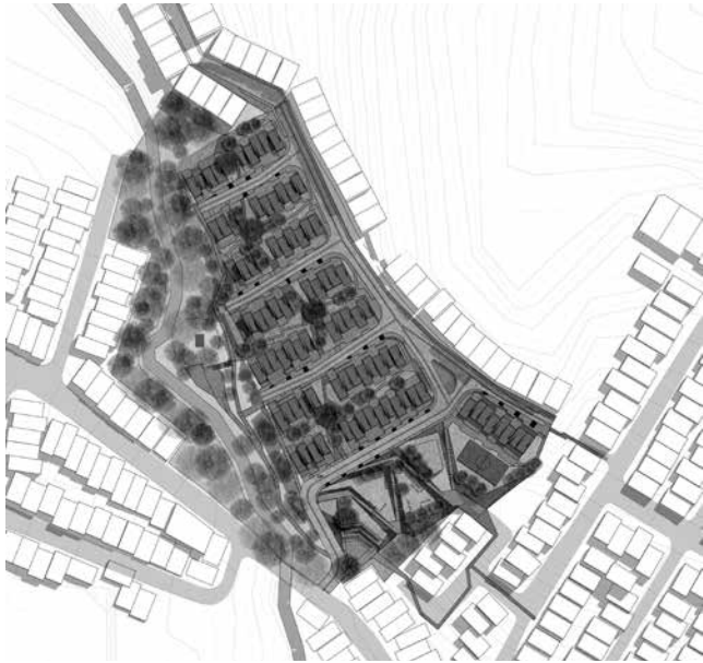
Figura 5: Diseño de sitio, se muestran los espacios de recreación entre las zonas de viviendas, la zona del parque recreativo y las unidades de vivienda.