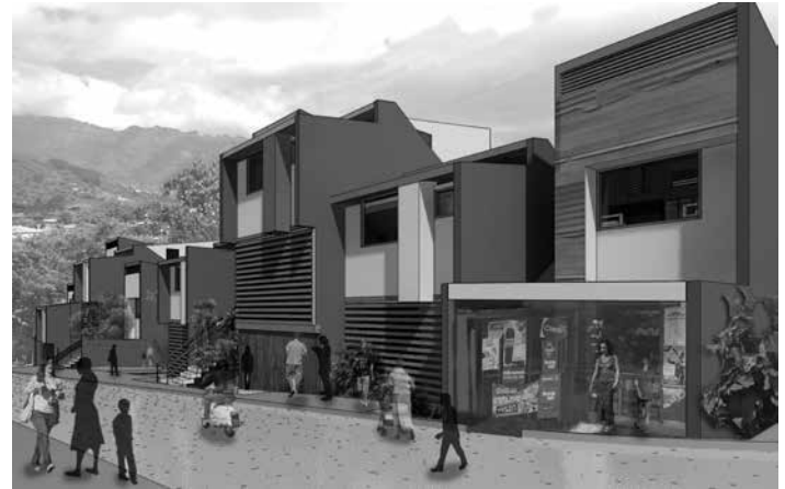
Figura 6: Propuesta de vivienda, ya con el paso del tiempo ha sido personalizada por sus residentes y con la creación de espacios productivos en los espacios destinados para crecimiento de las viviendas.