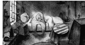
FOTOGRAMAS DEL F ILM: MAISON EN PETITS CUBES, KUNIO KATO, 2008.