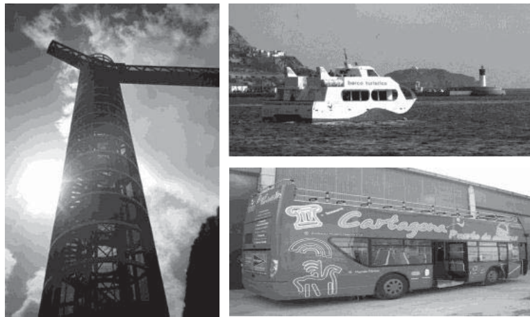
Figure 1: Algunos ejemplos de Infraestructuras y Transportes

Para conseguirlo, las actuaciones objeto de intervención para CPC y en las que se destinarán las subvenciones recibidas, serán sobre recursos patrimoniales susceptibles de explotación turística y las necesarias para su correcta explotación: infraestructuras turísticas y transportes.