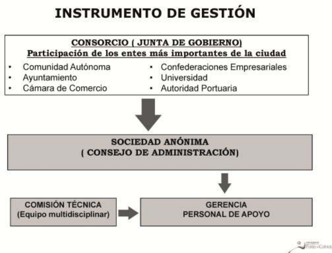
Table 1: Organigrama del Instrumento de Gestión de Cartagena Puerto de Culturas

Los resultados tras diez años de puesta en marcha de CPC son claros. El fuerte incremento del número de turistas que han visitado las nuevas instalaciones ha