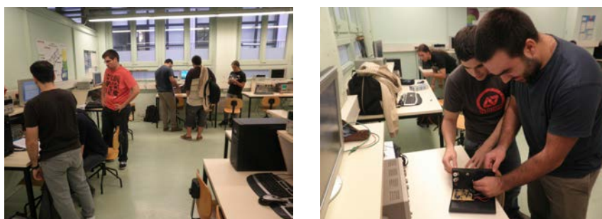
Fig. 2. Aspecte general del laboratori de l'assignatura durant una sessió d'AD en què es treballa en el muntatge i assaig del prototip que es porta a terme.