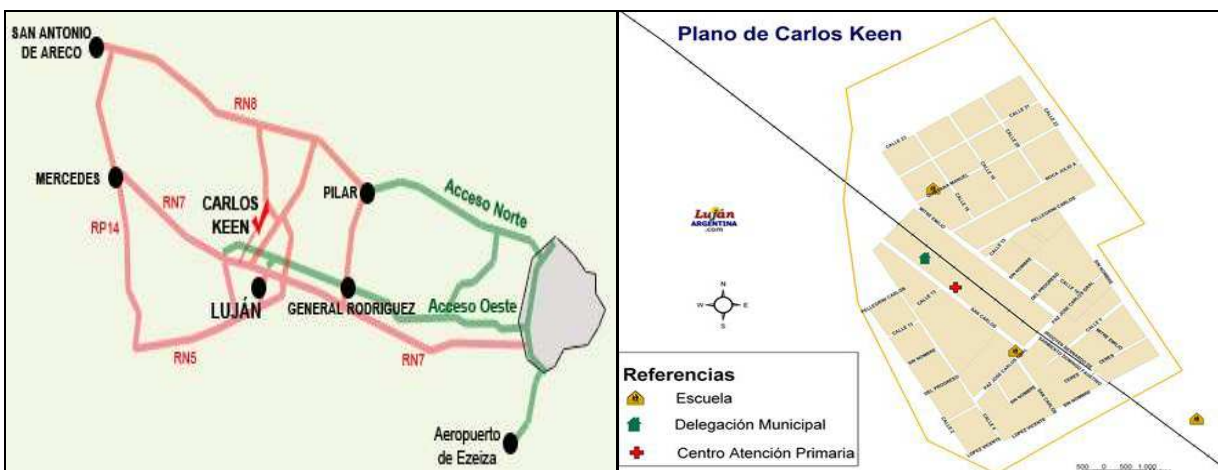
Plano N°1 y 2 Localización de Carlos Keen (partido de Luján) y planta urbana de la localidad

Así como se va modificando el paisaje rururbano de General Rodríguez a partir del deporte de elite, también en la localidad de Carlos Keen, partido de Luján (Plano N°1), se perciben lentamente transformaciones urbanísticas a partir de la revitalización de espacios históricos relacionadas con la producción rural 2 . Mirado desde el pueblo-rural, la llegada del turismo local en los alrededores de la antigua estación de ferrocarril, refuncionaliza viejos espacios productivos en tierras de “pan llevar”. Estos cambios en el espacio posibilitan, por una parte la afluencia de nuevos actores sociales emigrados de la Ciudad de Buenos Aires y partidos vecinos, y por otro, contribuye a la retención de la población estable, que de otra manera se vería obligada a migrar buscando mejores condiciones económicas.