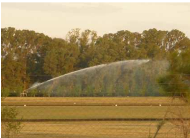
Foto N°2 Riego cancha de polo de Club Centauros (Lucas Renyinski)

La actividad del polo no está debidamente reglamentada en el partido de General Rodríguez. La ordenanza Municipal N°671/79 Delimitación Preliminar de Áreas del Partido de General Rodríguez y sus modificatorias, es decir sobre el Ordenamiento Territorial y Uso del suelo impuesto en la Provincia de Buenos Aires – Ley 8912/77 sólo contempla que los clubes y canchas de polo se instalen en aquellas zonas destinadas al Uso Agropecuario y las destinadas a Clubes de Campo, esto trae aparejado la falta de planificación en cuanto al recurso hídrico. Como es sabido el recurso agua es muy escaso. El gran problema al que nos enfrentamos actualmente es su demanda creciente, debido al aumento poblacional y como es en este caso a los nuevos estilos de vida (Foto N°2 ).