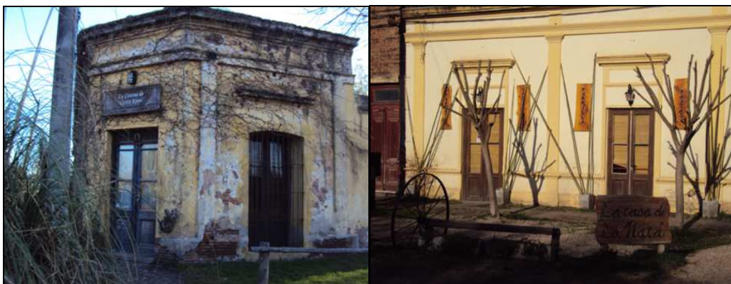
Foto N°3: “La Casona de Carlos Keen” y Foto N° 4: “La casa de La Nata” (Mufato, 2012)

que data de 1881 (foto N°3), los restaurantes “El Malvón”, “La Casa de La Ñata” (foto N°4), “La Amelia” y “Maclura” 3 (foto N°5), “Angelus” (foto N°6), la Parrilla “1907” y el alojamiento “La posada del Fuego” (Mufato, 2012).