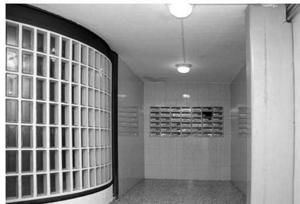
VISTA D'UNA ESCALA DE VEÏNS DESPRÉS DE LA INTERVENCIÓ.

Després que la Plataforma d'entitats presentés una al·legació al Pla Especial amb la proposta alternativa dels veïns, l'alcalde va acceptar la demanda de crear una comissió amb l'Ajuntament i la Plataforma per recollir les demandes sorgides. Finalment, en una reunió amb l'alcalde en la qual es van presentar les dues propostes, la de l'equip redactor i la de la Plataforma, l'alcalde va com-