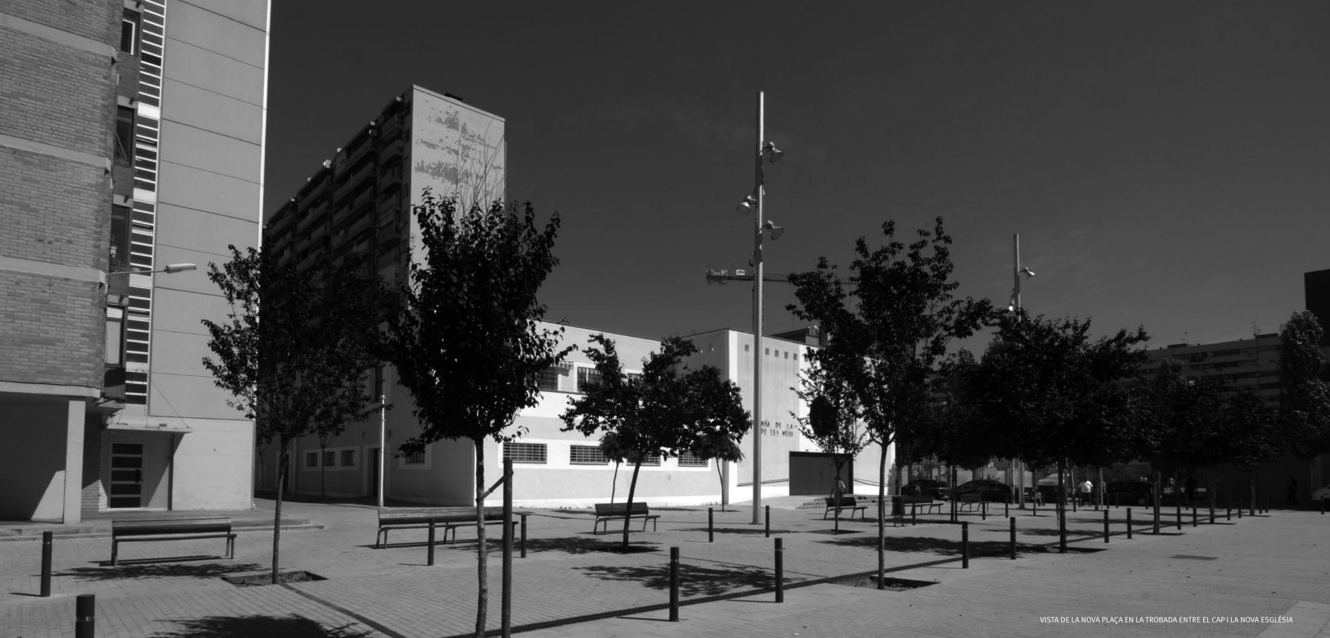
VISTA DE LA NOVA PLAÇA EN LA TROBADA ENTRE EL CAP I LA NOVA ESGLÉSIA