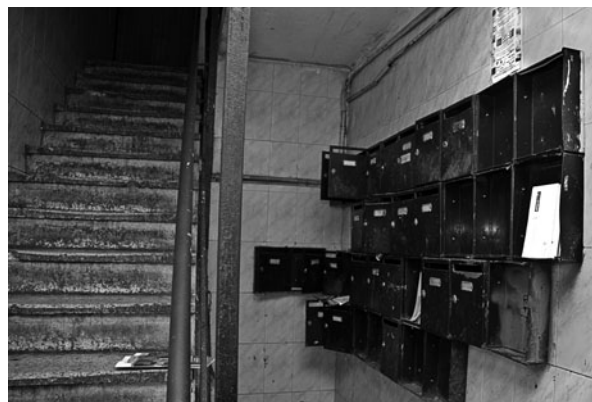
VISTA D'UNA ESCALA DE VEÏNS ABANS DE LA INTERVENCIÓ.

fonamental partir de l'escala edificatòria abans d'afrontar l'escala urbana, on calia resoldre primer els problemes de convivència en les escales dels blocs abans de voler resoldre places i passejos. Des d'aquesta perspectiva, una opció essencial que va aparèixer amb claredat va ser disminuir el nombre de veïns per escala i, en conseqüència, el nombre de friccions que poguessin tenir lloc en aquests espais. Posteriorment ja s'arribaria a la intervenció en la nova Rambla, element central de la proposta de l'equip redactor del Pla Especial. Per aconseguir-ho calia seguir un procés progressiu segons l'esquema: millorar les escales de veïns, recuperar els espais públics associats als blocs, millorar l'espai de la Rambla.