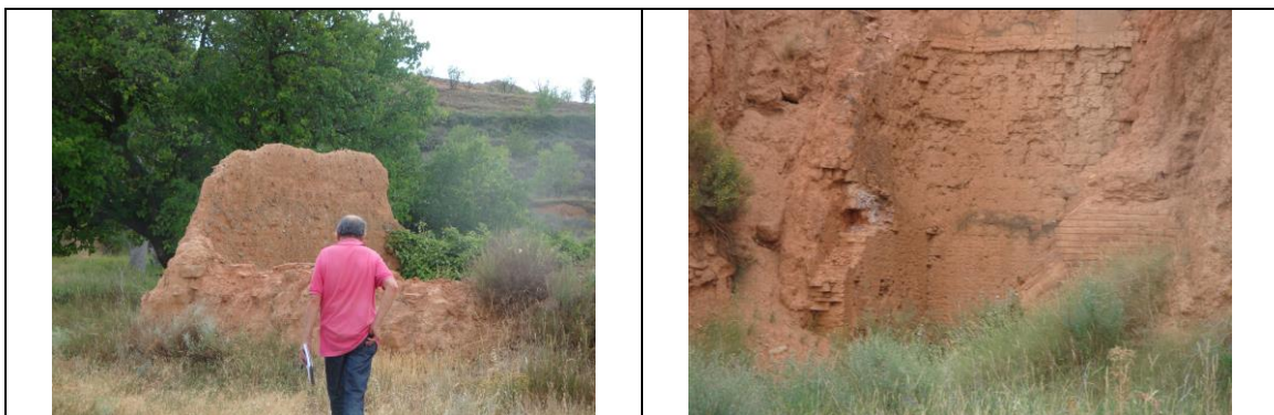
TEJERAS DE SANTA CRUZ DE MONCAYO y TARAZONA

Evidentemente, el Patrimonio Minero existente en la comarca del Moncayo, sin ser muy importante, es susceptible de ser utilizado en función de su valor científico, como del didáctico, del cultural o del turístico. Dentro de este grupo, cabría considerar el conjunto relacionado con las tejas de SANTA CRUZ DE MONCAYO y TARAZONA.