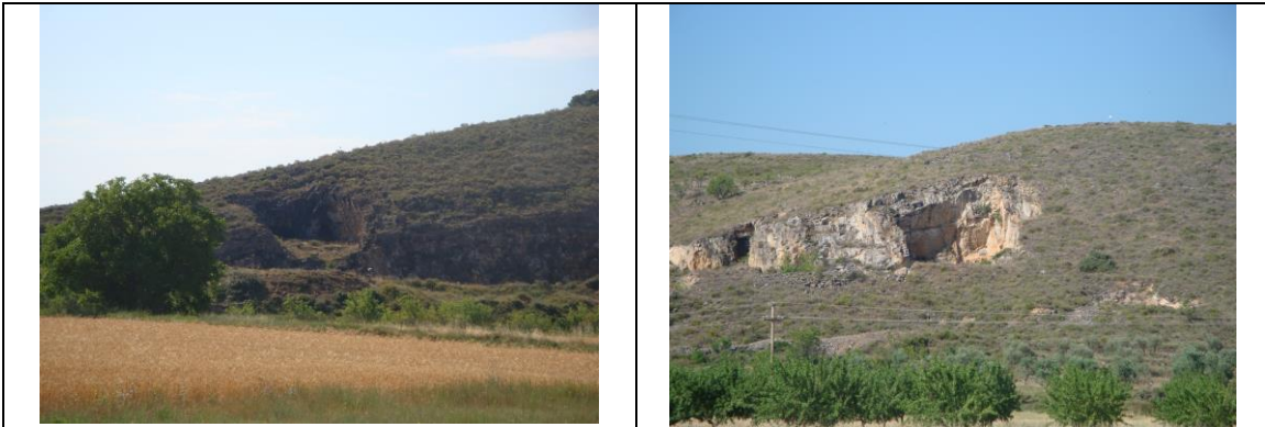
CANTERAS DE TRASMOZ y VERA DE MONCAYO

Estas explotaciones se sitúan tanto en el Sistema Ibérico como en la Depresión Geológica del Ebro . Aunque la mayoría están paradas, cabe decir que a diferencia de las anteriores, en muchos casos están a plena actividad. Las situadas en el Sistema Ibérico , en su mayoría pertenecen al Jurásico, distribuyéndose por las localidades de TRASMOZ y de VERA DE MONCAYO. Por su parte, las situadas en la Depresión Geológica del Ebro , perteneces en su mayoría al Mioceno, distribuyéndose las explotaciones por los municipios de: EL BUSTE y VERA DE MONCAYO.