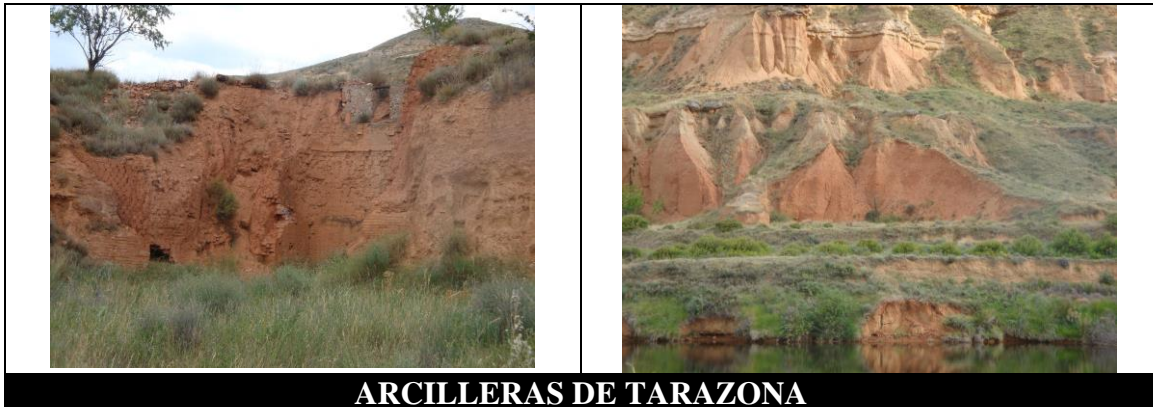
ARCILLERAS DE TARAZONA

Estas explotaciones se sitúan en la Depresión Geológica del Ebro , entre los materiales cenozoicos del Mioceno. Las más importantes se encuentran en SANTA CRUZ DEL MONCAYO y en el municipio de TARAZONA (en donde están la mayoría de ellas); aunque las de un municipio y las del otro están muy próximas entre sí. Cabe decir, que como consecuencia de estas actividades se ha generado cierto Patrimonio Minero, consistente en tejas .